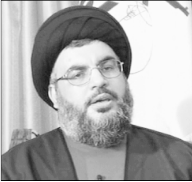
الشيخ حسن نصرالله

النصرالله الذي يرفض رفضاً قاطعاً توجيه اللوم الى الامين العام لحزب الله اللبناني، واتهم حكومة إسرائيل بالاعتداء على لبنان، مؤكداً ان الشيخ