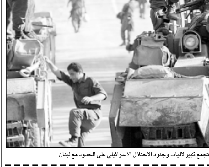
تجمع كبير لاليات وجنود الاحتلال الاسرائيلي على الحدود مع لبنان

1- ان الاحداث الاليمه التي تلاقت منذ ايام في لبنان، بعدما صصفت مدارج مطاراته، وحمل جسر طرقه، وبعض مصانع كهربائه، ومعظم مرافقه واجهزة الاتصالات، لهي احداث لا يبررها عقل ولا يقرها منطق. وان خلف جنديين، وهو عمل مهما قيل ويقال فيه، لا يستاهل