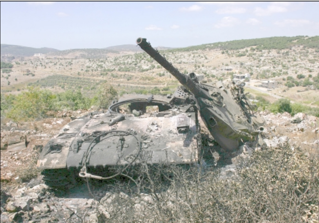
ديابة اسرائيلية مدمرة في عيتا الشعب

وبالتالي اضاف بيريتس ويتحتم على الحكومة الاسرائيلية ان تستخلص العبر والنتائج من هذه الحرب، على نفس الصعيد نقلت وسائل الاعلام الاسرائيلية عن الجنرال عاسوس يدلين، رئيس شعبة الاستخبارات العسكرية قوله ان ايران وسورية ستقومان باعادة تسليح حزب الله من جديد، وان مسألة عودة حزب الله بقوة العسكرية الى الساحة اللبنانية هي مسألة وقت ليس الا، لافتاً الى ان الحزب سيعاود الكرر ويهاجم اسرائيل لانه يشعر بانه حقق انتصاراً