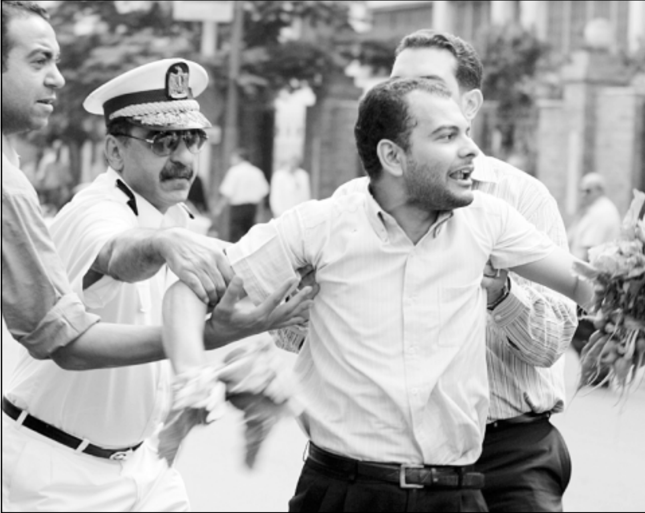
رجال أمن مصريون يوقفون صحافيا شارك في الاحتجاج على اغلاق صحيفة «أفاق عربية» أمام نقابة الصحفيين في القاهرة أمس