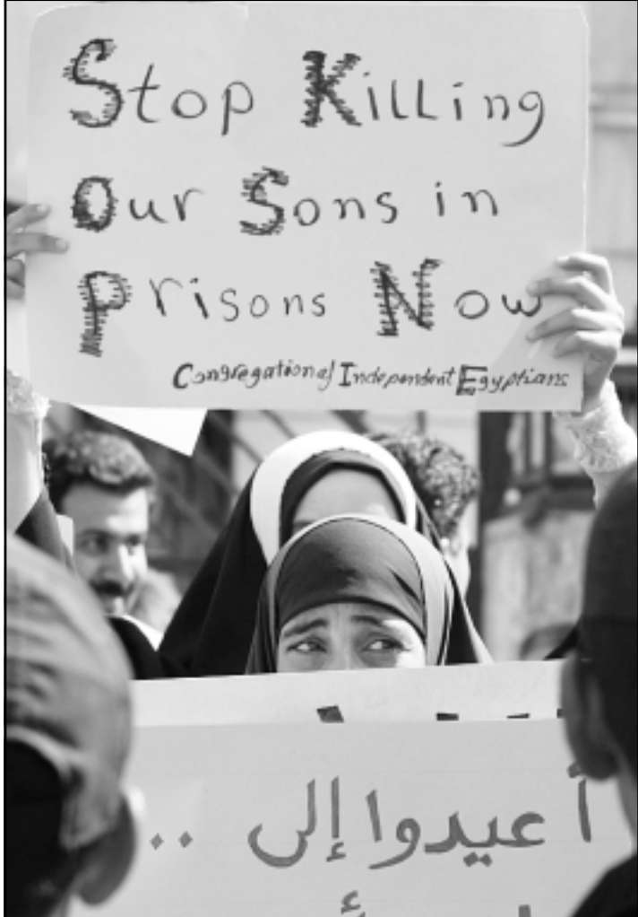
مظاهرات مصريات يطالبن بالإفراج عن المعتقلين السياسيين في القاهرة أمس