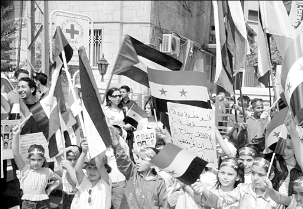
اطفال فلسطينيون وسوريون يتظاهرون للجمعة امام مقر الصليب الاحمر في دمشق مطالبين باطلاق سراح الاسرى في السجون الاسرائيلية

عون قبل ان يزعم انضمامه اليه من دون اغفال التضارعه في واشنطن لاستصدار قانون محاسبية سورية ومفاخرته بولاية 1589 قبل الانتقال إلى سورية حليف سورية الموضوعي ومرسحها الأول والسعد لزياراته قريبا في تصريحات وتصريحات مضادة لم تعد تنطلي على أحد». وأضاف «إن اصرار العماد ميشال عون على مغالاته في كلامه غير العاقل وتصرفاته غير المسؤولة، لا يمكنه سوى أن يزيد الشعب اللبناني قناعة بأن البلاد لا تدار بنوبات عصبية مصدرا الوحيد عدم قدرة العماد عون على تقبل فكرة وجود مرشحيه غيره من القيادات المارونية المحترمة والحكيمة لرئاسة الجمهورية، وأن من يستطيع أن يضبط لسانه أمام كاميرا تلفزيونية أو ميكروفون في مؤتمر صحافي لا يمكنه أن يرفع من مستوى الترشيح لسدة الرئاسة الأولى، وأن التوازن المطلوب في الحياة السياسية اللبنانية لا يمكنه أن ياتي من بعيش حالة انعدام وزن في كلامه وتصرفاته لا مثيل له سوى الحالة التي