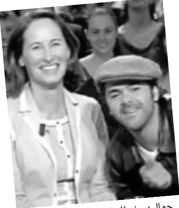
جمال دبوز والمرشحة الرئاسية سيغولان رويابل