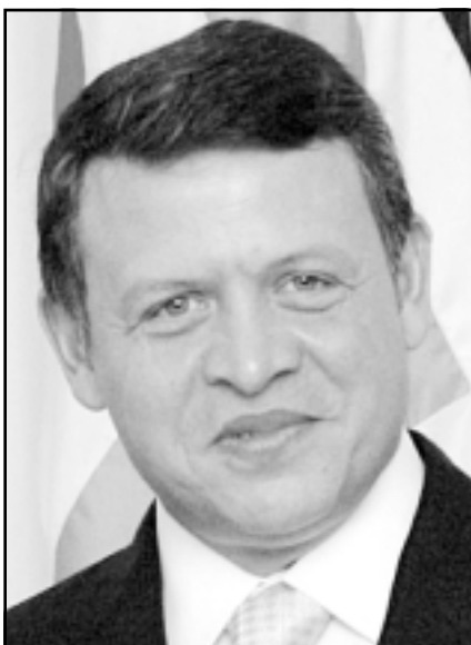
الملك عبد الله