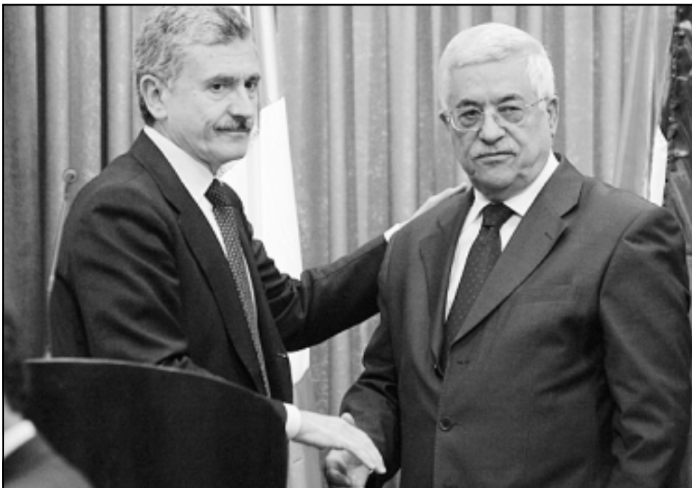
الرئيس الفلسطيني محمود عباس لدى استقباله وزير الخارجية الإيطالي ماسيمو داليمبا

الاسرائيلي والمباحثات مستمرة للتخضير لهذا اللقاء ونرجو ان يعقد (اللقاء) قبل نهاية هذا العام.