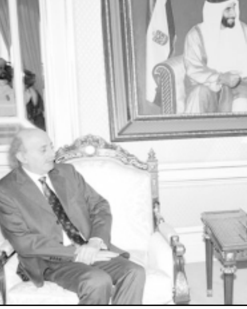
رئيس الامارات الشيخ خليفة بن زايد ال نهيان مستقبلاً النائب اللبناني وليد جنبلاط

والتقى رئيس الوزراء اللبناني فؤاد السنيورة في لندن رئيس الوزراء البريطاني توني بلير ويسعرض معه الأوضاع السياسية والعلاقات الثنائية ويطلب دعم بريطانيا للبنان من أجل انسحاب اسرئيل من مزارع شبعا.