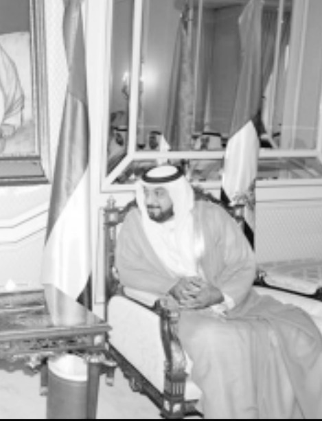
رئيس الامارات الشيخ خليفة بن زايد ال نهيان مستقبلاً النائب اللبناني وليد جنبلاط