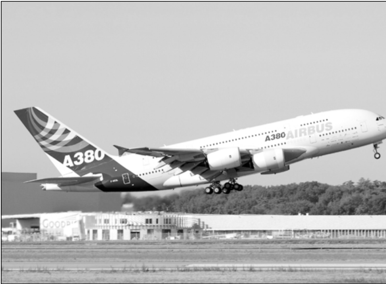
الطائرة العملاقة ايه 380 بعيد اقلاعها امس الاول من مطار تولوز الفرنسي

من ايلول (سبتمبر) الجاري احدها رحلة ليلية. وتقدمت 16 شركة بطلبات لشراء 159 طائرة من هذا النوع مقابل سعر مرجعي بلغ 228 مليون يورو ( 433 مليون دولار) للطائرة الواحدة. وسيتم تسليم اول نموذج من هذه الطائرة في كسانون الاول (ديسمبر) المقبل الى الخطوط الجوية السنغافورية.