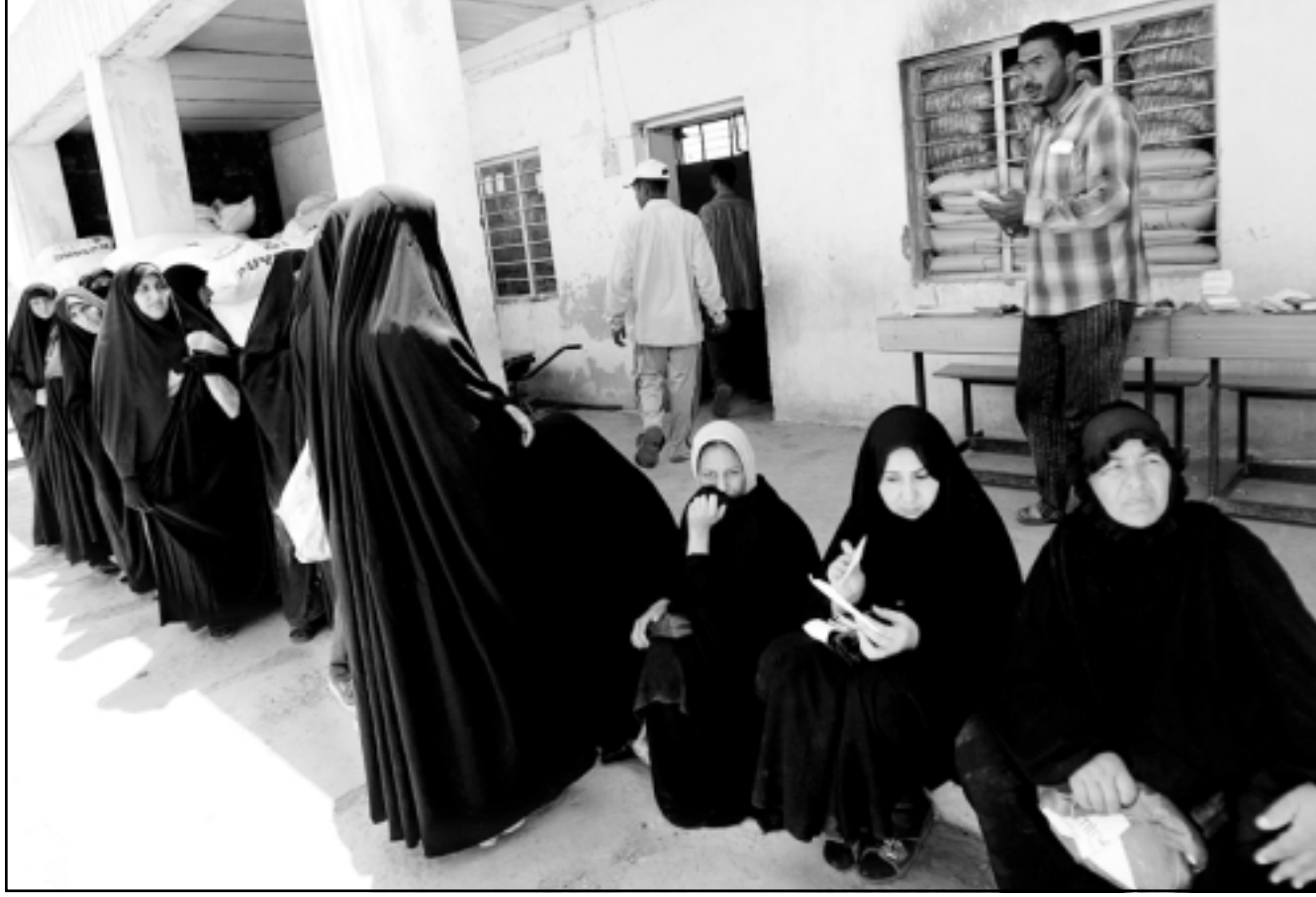
سيدات عراقيات من المهجرين ينتظرن الحصول على اعانات غذائية في بغداد امس

القاهرة - رويترز: قال آقارب واصدقاء مدون مصري فائز بجائزة «صحافيون بلا حدود» للمدونات على الانترنت ان السلطات أمرت بالفراغ عنه بعد بقاءه اسابيع حيسه مرتين لمدة 15 يوماً في كل مرة، وحسب الاجراءات المتبعة في الافراج عن المحتجزين لن يغادر سيف الاسلام محبسه قبل يوم الأربعاء. واشادت منظمة هيومان رايتس ووتش لحقوق الانسان التي تتخذ من نيويورك مقر لها اعتقال النشطاء منهم علاء سيف الاسلام وطالبت باطلاق سراحهم، وقالت المنظمة وقذكان «هذه