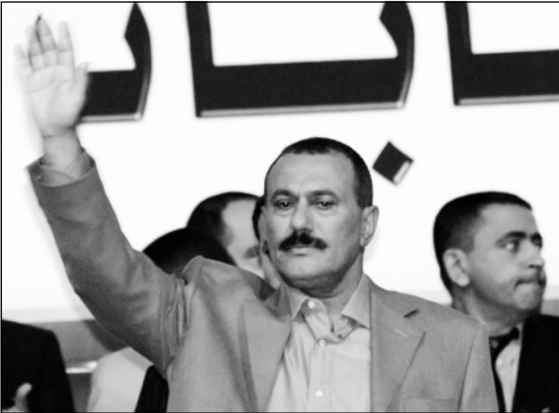
الرئيس اليمني اثناء حضوره المؤتمر الحزبي في صنعاء

حب خالد، وليس هو السبب الوحيد للتمسك به ولكن خوفاً على مستقبل بلادنا وأولادنا هو الدافع الرئيسي الذي يجعلنا نتمسك به الآن وتلك الضمانة السياسية التي اشترطها الأمين العام للحزب الاشتراكي اليمني الدكتور ياسين سعيد نعمان عند توقيعه اعلان المبادئ، بأن الضمانة السياسية الحقيقية هي بقاء الرئيس عبد الله صالح في قيادة البلد حتى تنتهي مؤسسات البلد الرسمية والشعبية للتداول السلمي للسلطة.. وكان صالح قال في جلسة الافتتاح للمؤتمر الاستثنائي «قد أبلغت أمين عام المؤتمر الشعبي العام أنتي أرفض أي مسرحية سياسية، والشعب اليمني يتحمل مسؤوليته التاريخية..» وأضاف «لست مريضاً ولا عاجزاً عن تحمل المسؤولية، لكن ما أنجزته من وحدة وتمحيص شاملة، يجعلني أزعج هذا الإنجاز عندما أسلم السلطة لسليما للشعب اليمني». وأوضح صالح أن «الشعب اليمني غني برجائه المخلصين، البلد مستقر والأمن مستتب، وليس هناك قلق على مسيرة الوحدة والتخمين والديمقراطية». وشدد على أنه سيتمسك بحقه الدستوري في أن ينتخب الشعب اليمني رئيساً جديداً للبلاد، وقال «هناك مؤسسات الدولة وهي كغاية كفاءة في شاطئ الأمان». وأكد صالح أن قراره بالتخلي عن السلطة لم يكن مفاجئاً للمؤتمرين أو الشعب اليمني، «لقد أبلغتكم قبل 11 شهراً وأربعة أيام أنتي