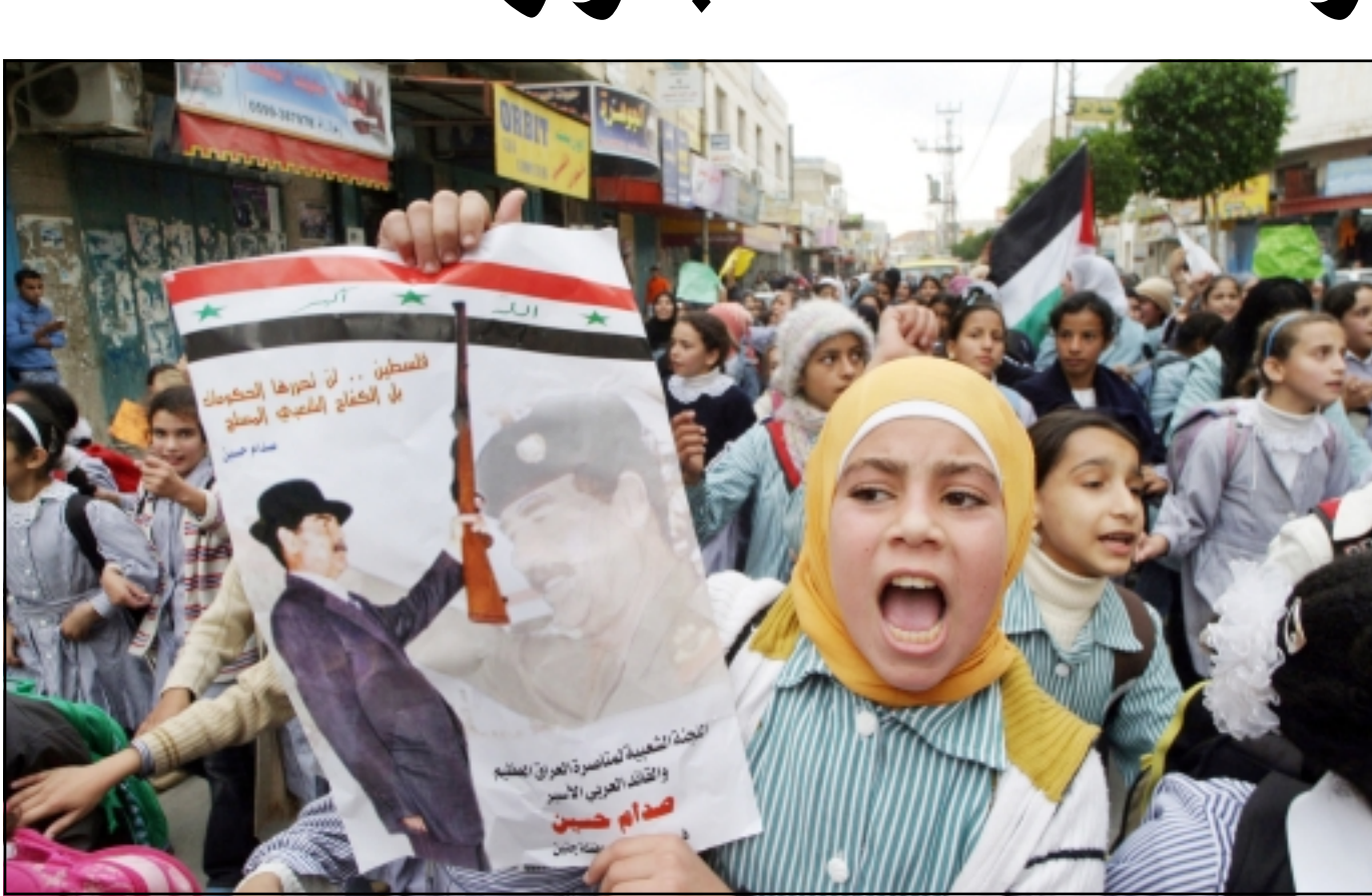
اطفال فلسطينيون يتظاهرون في جنين للتنديد بقرار المحكمة باعدام صدام حسين