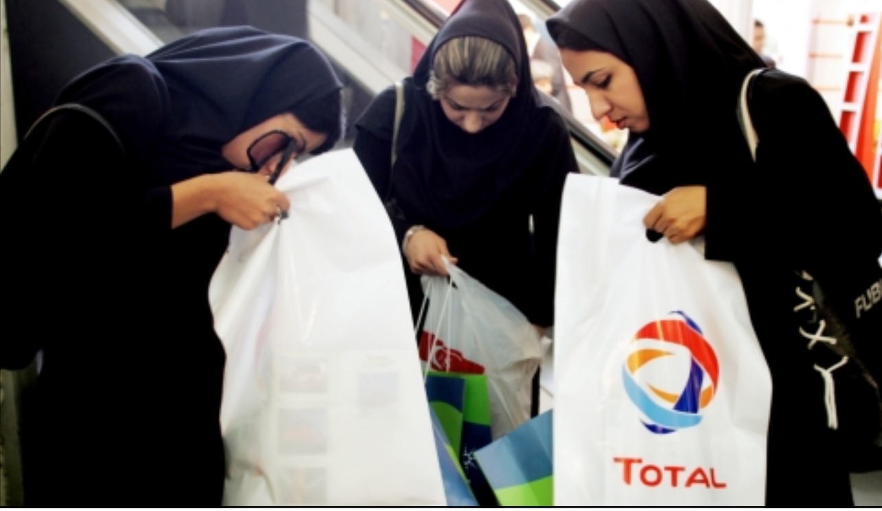
سيدات إيرانيات في افتتاح معرض للغاز والبتروكيماويات في طهران أمس (ا ف ب)

اعتبرت الاصلاح «متعثراً» في مصر و«بطيئاً» في السعودية