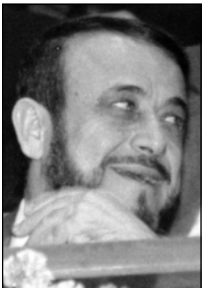
مريد - القدس العربي: من حسين مجدوبي:

أفادت صحيفة (الموندو) في عددها الصادر أمس الخميس أن القضاء الإسباني أمر باعتقال رفعت الأسد المليونير العربي وعم الرئيس السوري الحالي بشار الأسد بسبب الاشتباه في تورطه في الفاضح العقارية في مدينة ماربيا جنوب اسبانيا. وصدر أمر الاعتقال عن قاضي التحقيق فرانسيسكو خافيير دي أوركيما عن الغرفة الثانية في محكمة ماربيا. وكان القاضي قد وجه استدعاء لرفعت الأسد للمثول أمامه على الساعة الحادية عشرة من الأربعاء للتصريح بصفته متهمًا لكنه لم يحضر. وسبق أن تغيب عن الحضور إلى المحكمة الأسبوع الماضي للغرض نفسه، وأكد محاميه أنه يوجد في الخارج. ولا يعرف هل يتواجد رفعت الأسد في اسبانيا أو خارجها. ونتيجة هذا الغياب جاء في المذكرة أنه يجب استخدام رفعت الأسد بالقوة إلى المحكمة بسبب المخالفات الكثيرة التي تم تسجيلها ضده. وأكدت الصحيفة أنه من المحتمل أن يكون القاضي قد أصدر مذكرة بحث وتوقيف أمس أو اليوم في حق رفعت الأسد. ويسود الاعتقاد أن القاضي لم يكن يفكر في اعتقال رفعت الأسد بل فقط الانشغال إلى تصريحاته بشأن ما اعتبره مخالفًا للقانون مثل حصوله على معاملة تفضيلية من بلدية ماربيا في مجال العقار. والمثير أن ضمن الذين تقدموا برفع دعوى ضد رفعت الأسد منذ القصار السوري - الأرحنجيني الذي اشترى بيعة الأسلحة، حيث يتهمه بارتكاب خروقات من ضمنها الاستحواذ على أموال رورديغيت سبتيرو إلى حل بلدية ماربيا وتعيين لجنة تسهر على تسجيرها إلى غاية الانتخابات البلدية المرتقبة في أيار (مايو) 2007.