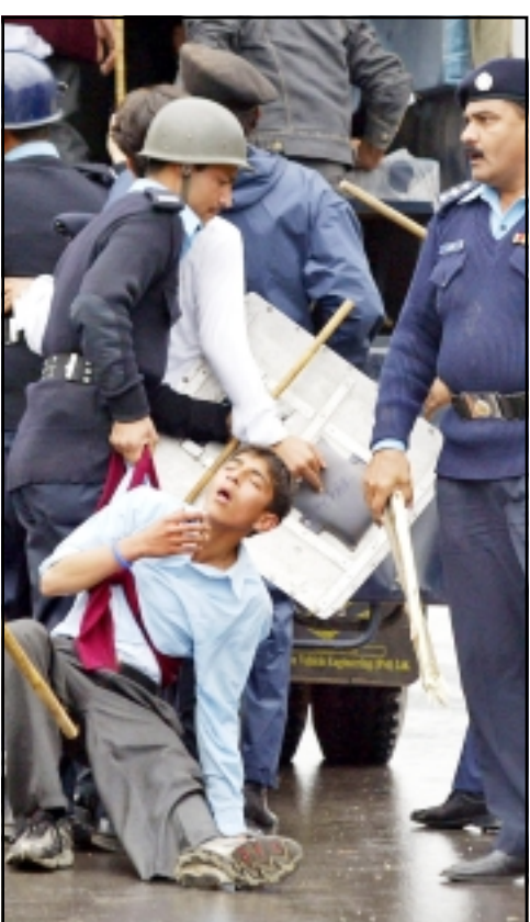
رجال شرطة باكستانيون يعتقلون طالباً في تظاهرة جرت في اسلام اباد امس (1 أ ب)

في عالم الانترنت مجهول الهوية يهاجم كتاب مدونات سعوديون الحكومة بسبب ما يعتبرونه دورها في آتارة المسلمين في شتى انحاء العالم بسبب رسوم كاريكاتورية للنبى محمد. ويعرض هؤلاء افكارهم باللغة الانجليزية بشكل اساسي. وهي افكار لا تجرؤ احد على التعبير عنها في وسائل الاعلام السعودية المملوكة للدولة، ويتهم هؤلاء الكتاب السلطات السعودية باستغلال الرسوم بعد شهرين من نشرها لأول مرة وتجاهل القضايا الاسلامية.