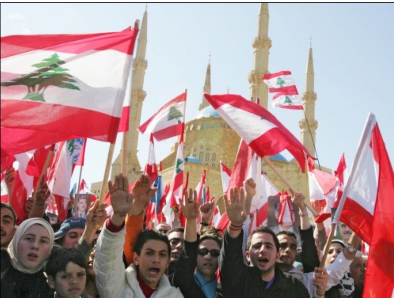
متظاهرون لبنانيون يلوحون بالاعلام خلال تظاهرة في وسط بيروت بمناسبة سنة على اغتيال رئيس الوزراء اللبناني الاسبق رفيق الحريري

الرئيس السوري بشار الاسد وعلى لشود فاستهم الاول بانه «ارهابي» والثاني بانه «عميل»، وقال «رمز العمالة والارتها للنظام السوري قابع في بعيدا» في إشارة الى الرئيس لحود والى مقر الرئاسة في بيروت في ضاحية بيروت الشرقية. وأضاف بك بشار الارهابي وسيروح بك شعب لبنان الالبي». وقال «يا حاكم دمشق أنت العبد المأمور» في تذكير لعبارة استخدمها