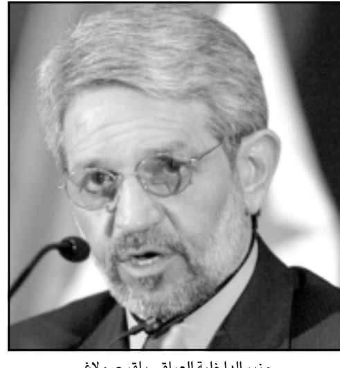
وزير الداخلية العراقي باقر صولاغ

الحلة للسنة اشهر القادمة وخاصة في مناطق جرف الصخر والليطيفية». مؤكداً ان «تسليحهم سيكون على درجة عالية من الكفاءة». وأضاف وزير الداخلية في مؤتمر عقده في مقر أكاديمية الشرطة في الحلة ان هناك «خروقات تحصل في السجون العراقية كما هو حاصل في كثير من بلدان العالم، وهي مسألة طبيعية جدا اذا أخذنا بنظر الاعتبار ظروف البلد، ولكني أؤكد أننا سنحاسب أي شخص يقوم بعمليات انتهاك لحقوق الانسان». من جانب آخر توقع قائد قوات حفظ النظام اللواء مهدي صبيح الغراوي ان تكون عملية الهجوم على مقر شرطة القادسية الثلاثة تمت عبر تواطؤ احد افراد الشرطة الموجودين في المنطقة. وقال في مؤتمر صحافي عقده في بغداد «ان العملية كانت منطمة ومعد لهل مسبقاً وهذا ما يدعو الى ان نشك في وجود تواطؤ من قبل بعض افراد الشرطة