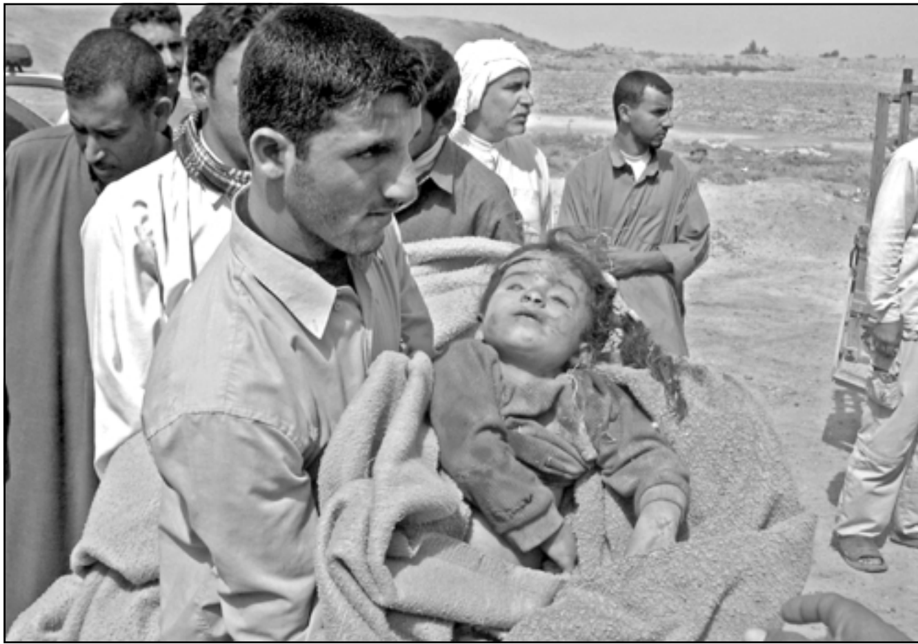
عراقي يحمل جثة طفل قتلته القوات الامريكية في مجزرة مدينة بلد الاسبوع الماضي

ظهرت في الساحة العراقية عدة جهات غامضة تمارس اعمال المافيا باحث الاساليب. وبعد اعلان سفير امريكا في العراق زلمي خليل زاد عن وجود «فرق موت» ينتمون الى جهة أمنية رسمية تقوم بقتل المواطنين في الشوارع، لامت الحكومة ذلك الموضوع دون توضيح بعد ان أعلنت انها شكلت لجنة للتحقيق بالامر. ويرى المواطن جمال نجم ان «العراق يمر اليوم بمرحلة لم يسبق له ان يمر بها من قبل فالوطن العراقي جاهز في كل الاوقات لكي تحتطف الروح منه لأي سبب كان وتحت أي ذريعة وما أكثر الذرائع. فقد أسست مهنة القتل من انشط المهن هناك تشب نار هنا وأخرى هناك ويريد البعض أن يجعل من أهل العراق حطباً لتبقي مؤفة. فأين الحرية وأين الديمقراطية بل وأين حقوق الانسان؟ هل ان ضريبة الخالص من الديكتاتورية هي تشريد وقتل واياة مدن بأكملها؟ واما فرج حسن فيقول «كم من الوقت مضى ولم يستطيع السياسة تشكيل حكومة تنجي الشعب العراقي من القتل المبرمج هذا القتل غير العشوائي والذي أدى الى حرب اهلية (طائفية) وان نكتر لها اولئك».