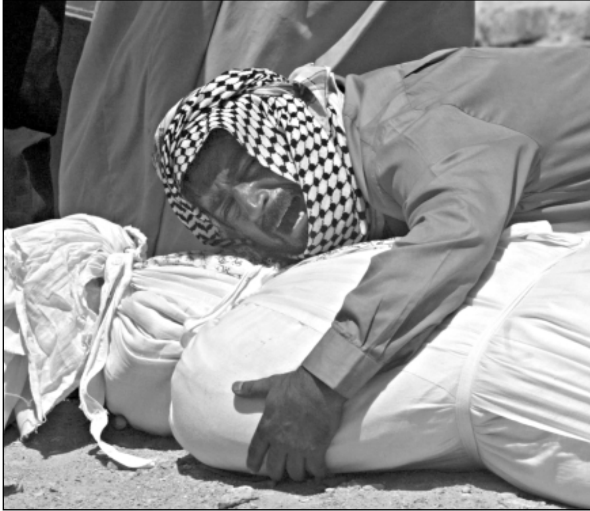
عراقي يبكي قريبا له اثناء تشييعه امس