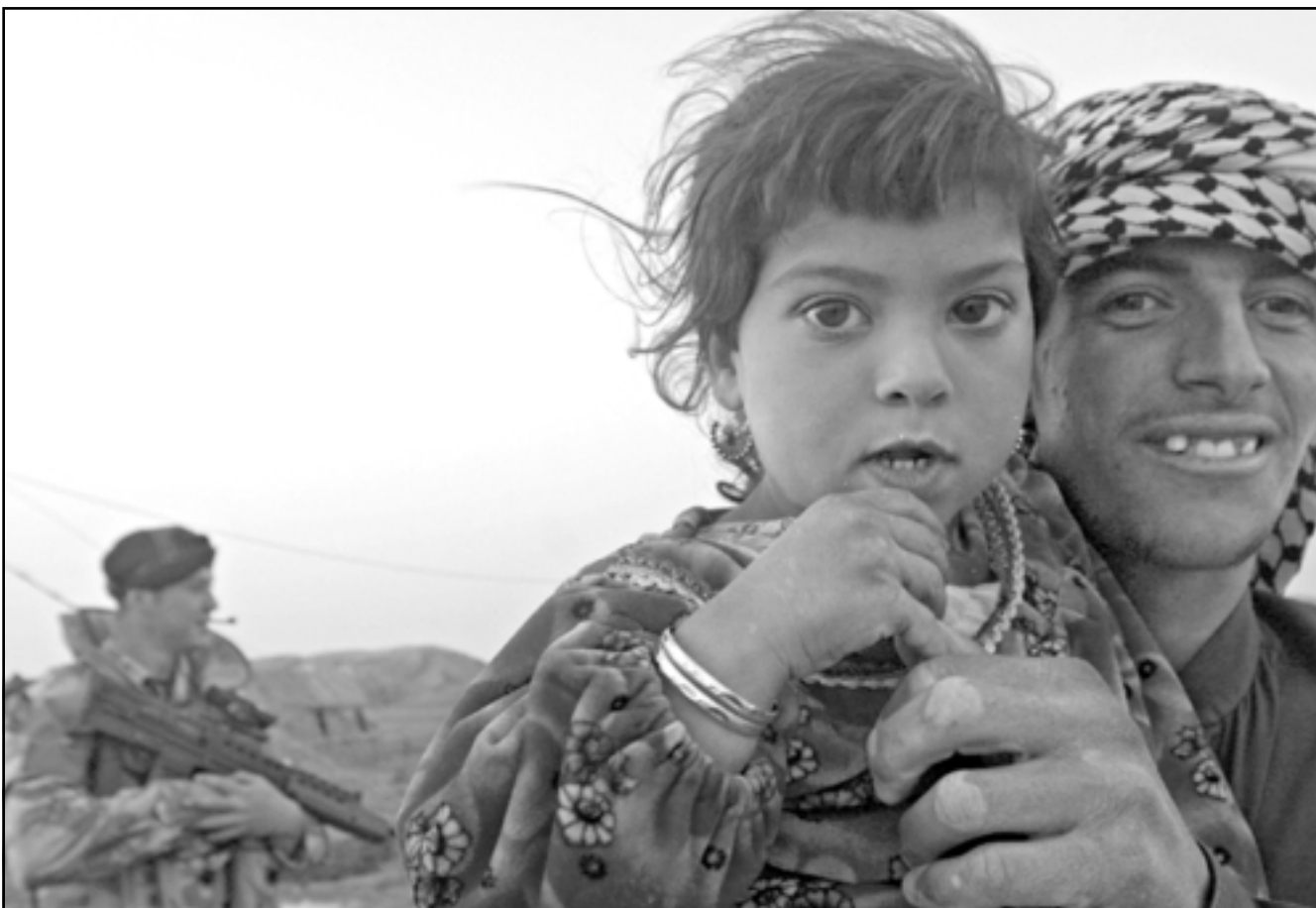
عراقي يحمل طفلة امام جندي بريطاني على حاجز في قرية ام الرصاص على الحدود العراقية الايرانية