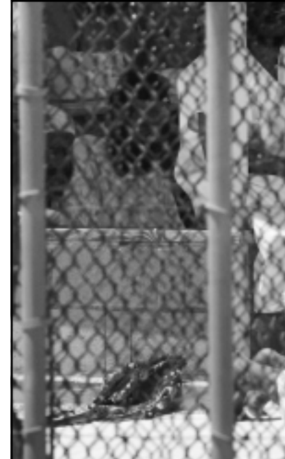
صورة من الارشيف لمعتقلين في غوانتانامو يؤدون الصلاة

ويدرس المصري الان امكانية اقامة الدعوى التي يحقق فيها ايضا مدعون المان و اعضاء في البرلمان الالمانى والاروبي امام محكمة امريكية اعلى درجة او هيئة دولية مثل محكمة العدل الدولية في لاهاي. وفي قضية اثار انتقادات حادة للاساليب التي تنتهجها الولايات المتحدة في الحرب على الازهاب يقول المصري ان وكالة المخابرات المركزية الامريكية نقلته نحو من مقدونيا الى افغانستان في 2004 واحتجزته لاشهر للاشتباه في ضلوعه بالازهاب قبل ان تطلق سراحه دون توجيه تهم اليه ونقلته الى البانيا حيث بقي به في طريق مجهور. ورفضت واشنطن التعقيب على