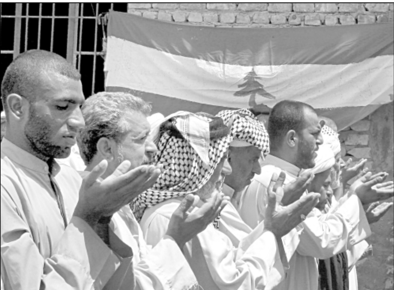
عراقيون يصلون الجمعة والى جانبهم العلم اللبناني