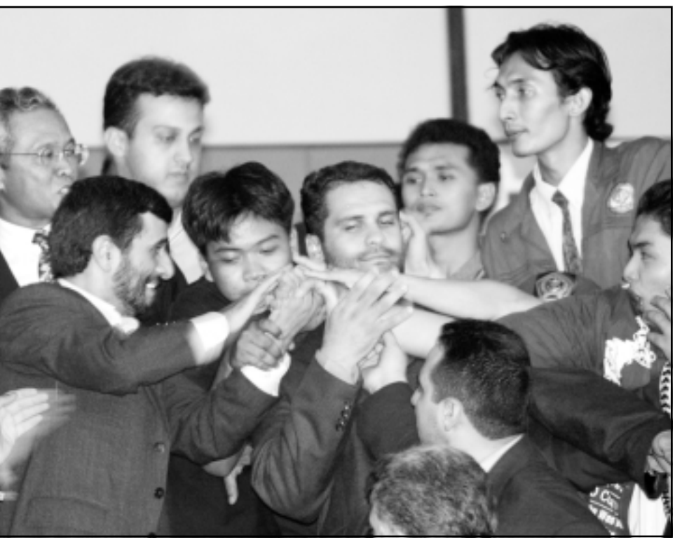
الرئيس الايراني لدى لقائه بطلاب جامعيين باندونيسيا

في تصريحات منفصلة قال الرئيس الايراني امام طلبة إحدى الجامعات الذين استقبلوه بحماس وتصفيق شديد ان اسرائيل كيان خلقته أوروبا ولا مكان له في الشرق الاوسط، وكان احمدى نجاد قال في مقابلة مع محطة تلفزيون (منزو) المحلية اذيعت في وقت سابق ان البرنامج النووي الايراني، ليس له أي علاقة بالاسلحة أو الأغراض العسكرية. وقال ايضا انه «من المثير للسخرية» ان تمارس الدول التي لديها ترسانات نووية ضغوطا على ايران لكيح مسعها لتطوير الطاقة النووية السلمية، وأضاف «اننا أيضا نمتلك القدرات التقنية وقدرات أخرى للدفاع عن مصالحنا».