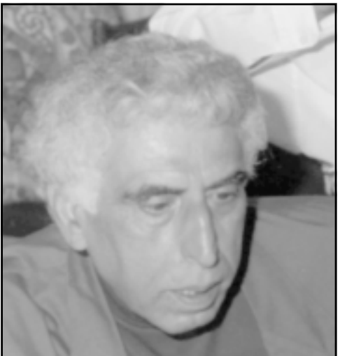
مراكش - «القدس العربي»:

قال الشاعر العراقي سعدى يوسف إنه لا يعمد إلى استغلال الأساطير في شعره لأنه يعتبر أن «أساطير الواقع أكثر جونا» ولأن «الهة الأساطير أقل حقاً»... سعدى يوسف