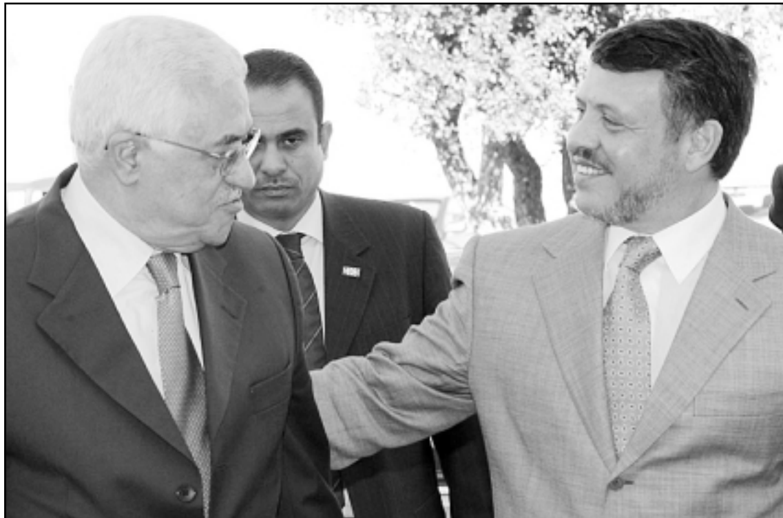
الملك عبدالله الثاني لدى استقباله الرئيس الفلسطيني محمود عباس في عمان امس

الجبهة الشعبية تشكك في مشاركتها في الحكومة واسرائيل تعتبر الاتفاق فارغ المضمون