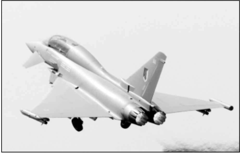
صورة من الأرشيف لطائرة التايغون

المبرمة بين السعودية وأضحك شركات صناعة الأسلحة في بريطانيا (بي ايه إي سيستمز). وكانت تقارير صحافية ذكرت ان السعوديين هدوا بإلغاء صفقة ملحقه باليامة لشراء مقاتلات يورو فاير من الشركة البريطانية قيمتها 6 مليارات جنيهه إسترليني ما لم يوقف المكتب التحقيق ومنحوا لاندن مبلغ 10 ايام. ووصف النائب عن حزب الديمقراطيين الأحرار نورمان لامب قرار وقف التحقيق بأنه «مخجل وشيع ويسيء إلى سمعة المملكة المتحدة». وسأل لامب كيف يمكن لنا بعد الآن ان نحاضر أمام العالم النامي بعلم السياسة».