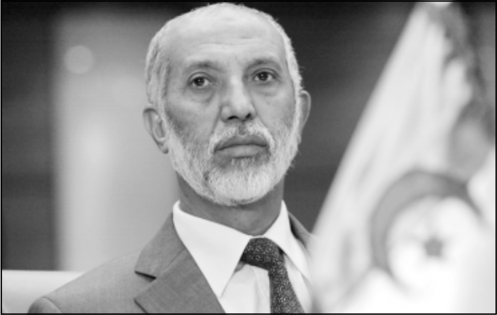
عبد العزيز بلخادم