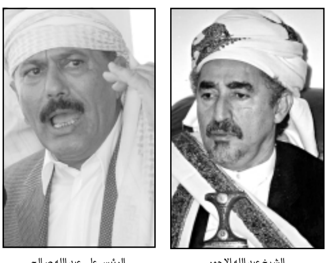
الرئيس علي عبد الله صالح

تكتل المعارضة ويدعم المرشح الرئاسي النافس فيصل بن سلمان. أما موقف تجله حسين وانتقاده للرئيس صالح رغم انه عضو في المعارضة الذي يضم سبعة منظمات بينها الحزب الاشتراكي اليمني صالح وحزب المؤتمر الحاكم، معتبرا ان «لا تعبر من قريب او بعيد عن رأيي وموقفه». ووصف الشيخ الاحمر مواقف تجله الاكبر حميد وتصريحاته المناقدة لحزب المؤتمر الحاكم بأنها مواقف حزبية لانه ينتمي الى التجمع اليمني للاصلاح الذي يقود