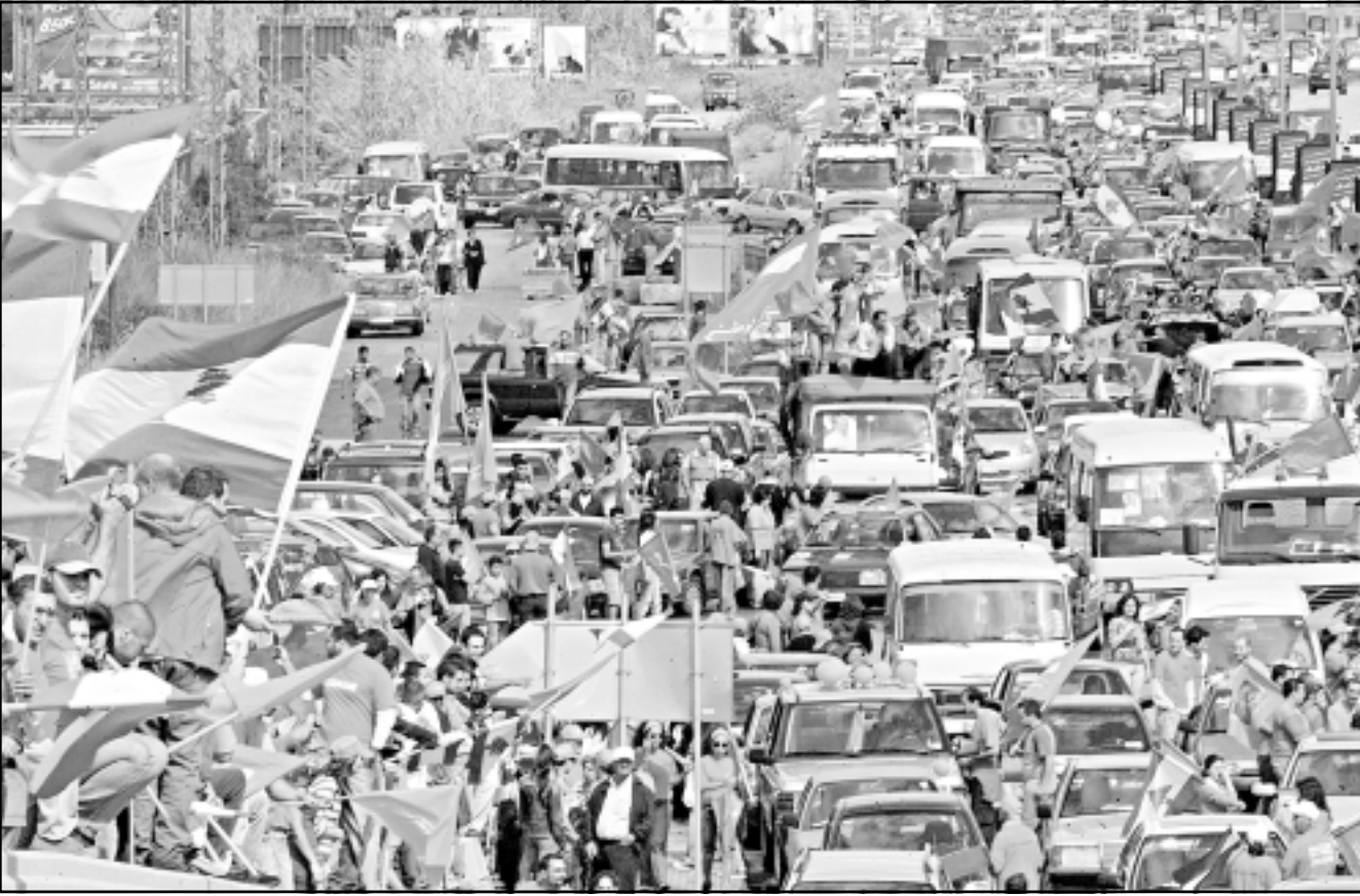
انصار عون يستمعون لخطابه وسط بيروت

وقد اطلق عون سلسلة مواقف في مؤتمر دولي اسلامية ما هو الا لتعزيز الخوف بخيبة إبقاء اللبنانيين في الشرايق المظلمة... وحول العلاقة مع سورية دعا عون إلى إقامة علاقات طيبة وصحية مع دمشق وإلى مراجعة الماضي وأخذ العبر منه ورفض العودة اليه وإلى أي شكل من أشكال الوصاية... وفيما واصل العماد عون هجومه على الحكومة وعلى رئيسها فؤاد السنيرة متمنيا إياها بالتوقيع على كل