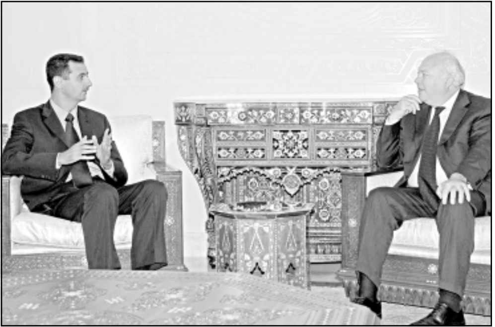
بشار الاسد لدى لقائه وزير الخارجية الاسباني ميغيل موراتينوس