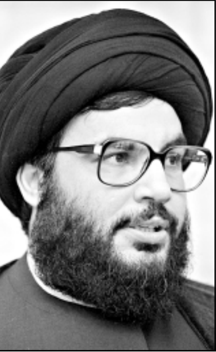
الشيخ حسن نصرالله