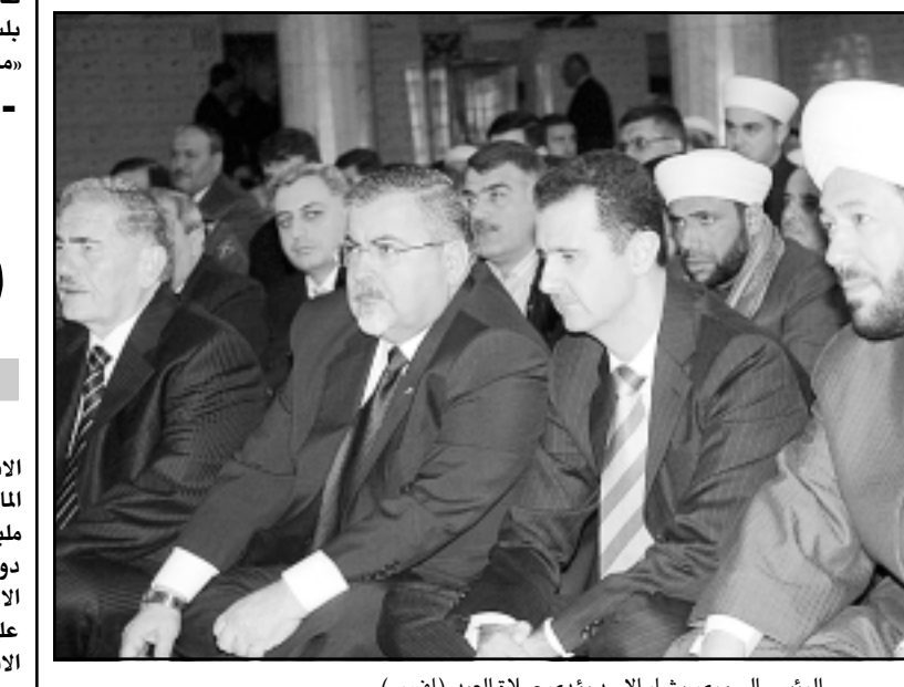
الرئيس السوري بشار الاسد يؤدي صلاة العيد (أب ف)

الناصرة-القدس العربي- من زهير اندراوس: ذكر المراسل السياسي لصحيفة (يديوتس احرونوت) الاسرائيلية يتعارم ايختر، امس الأربعاء ان حجم المساعدات المالية الامريكية لاسرائيل للعام الحالي 2006 سيجبل 16,3 مليار دولار منها 240 مليون دولار لاهداف المدنية و40 مليون دولار لتشجيع الهجرة اليهودية من اصقاع العالم الى الاراضي الفلسطينية، على حد قول الصحيفة التي اعتمدت على مصادر وصفتها بأنها رفيعة المستوى في الخارجية الاسرائيلية. وهذا وتوقع المعونات الامريكية المذكورة لهذا العام ما قدمته واشنطن لتل ابيب العام الماضي بنحو نصف مليار دولار، اضافة الى ذلك قال الصحافي الاسرائيلي ان الكونغرس الامريكي اتخذ قرارا ينص على الاستمرار في مشاريع امنية مشتركة في العام الجديد، وانه تم تخصيص مبلغ 600 مليون دولار اضافي لهذه المشاريع من قبل واشنطن. ومن ضمن هذه المشاريع مشروع مشترك لتطوير صاروخ (حيثس ) الاسرائيلي ابي (سهم) بالعربية والذي تعتبره الدولة العبرية من اناج الوسائل الدفاعية ضد صواريخ الدفاء التي كالتى بجورة طهران، مثل الصواريخ من طراز شهاب-3، والتي يصل مداها وفق المصادر الاسرائيلية الى الالف الكيلومترات. على صلة بما سلف قالت الصحيفة الاسرائيلية ان وزير الخارجية سيلفان شالوم، أكد صحة الخبر و اضاف قائلا ان