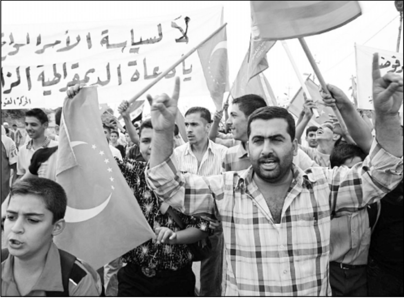
عراقيون تركمان يتظاهرون في كركوك احتجاجا على ما يسمى «تطبيع الأوضاع» في المدينة التي تشهد توترا عرقيا متزايدا

المسحراتي الذي كان يقوم بإيقاظ الناس في وقت السحر بسبب كون الوقت ضمن حظر التجوال إضافة إلى الخشية من التعرض للقتل للاشتباه به، كما أن مشكلة انقطاع التيار الكهربائي التي ازدادت هذه الأيام زادت الأمور سوءاً حيث يتم الفطور والمرة عصراً، والمواطنون يمكثون في بيوتهم قبل الإفطار بساعات ويعدون ونسوا الزيارات الرمضانية بين الأهل والأصدقاء. وقد غابت معالم الزينة عن شوارع بغداد ولا توجد علامات على حلول شهر رمضان كما كان يحصل في السابق، واختفى