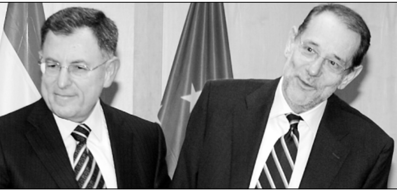
خافيير سولانا وفؤاد السنويور قبيل لقاء ثنائي في هامش اجتماعات الاتحاد الاوروبي في بروكسل امس

التي اوقفت في ساو باولو في 12 آذار/مارس، وقال السنويور في بروكسل «ثقتنا كاملة بهم ونحن على علاقة ممتازة مع السلطات البرازيلية» مشدداً على ان بلاده تعتمد على مساعدة السلطات البرازيلية في هذه القضية.