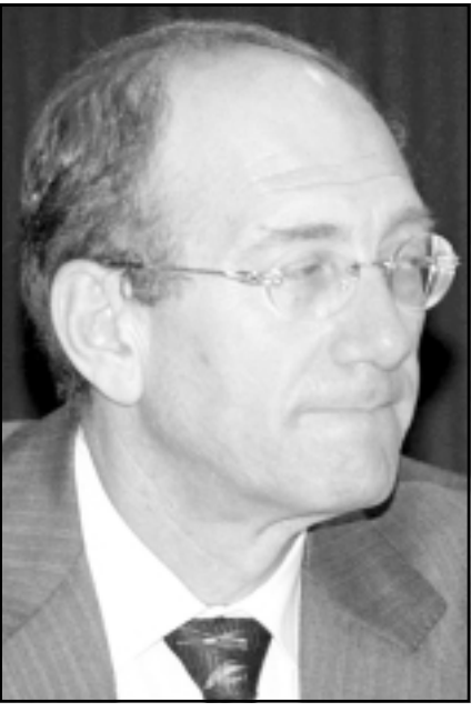
ايالون اولمرت على تنظيف الحظائر الملوثة والبدء باسرائيل من جديد؟ أري شيبوت كاتب يساري (هآرتس) - 14 / 9 / 2006

استعداده لاستغلال مصر امة بغرسة ساخرة واتباع نظام وقح لا ينجح على قاعد -«عطني فسأعطي»، وهنئيس في الاهدس لك». الصحافيون و«دورود ويرنستن نلقا امريكا من غش ريتشارد نيسون ونصبه، اولمرت هو شخص محظوظ بالمقارنة معه. هو يواصل بلا ازعاج القيام بما يجيده جدا: صفقات تلو الصفقات مع اصحاب المصالح والتهمين بلاذا السياسة الصغيرة وبورود الجمهور تطيل فترة انجازاتها في سجلات الطابو وكالات العفارات. فقد يصبى الصلاحيات الاخلاقية التي كانت تمنع في يومه على احترام والتقدير عند أي أحد، مع القدرة على تنفيذها من دون صلاحية اخلاقية لان يكون يماكتها آن بعد اسرائيل للتحديات القادمة. من دون صلاحية الاخلاقية لن يكون قادرا على تسيير حكمه ايضا، مسيرده مشكلة الان ليست الشخصية نفسه وإنما الظاهرة، ذلك لان هذا الشخص الهزلي يفسد في شخصه الصورة المتفرقة لواء حضاري وقفاي عميق. التنازل عن افكار وعن مبادئ وعن عقائد اساسية وعن رؤية وعن نظرة ومن ثمل توقيع، الانهاء الذي يفتقر للضمير يوقود إلى الفصل الموقع سلفا.