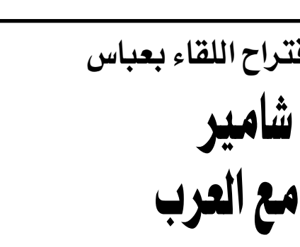
رامي طال / افتتاحية (يديعوت احروروت) - 14 / 9 / 2006

الافراج عن قنطار سيكون مفضلاً ومزعجاً، ولكن من الصعب ادعاء أنه يضر بشكل ما بأمن الدولة. فقد تأملت هذه الحكومة في بداية الحرب، وذلك حين أعلنت بأن أحد أهدافها هو الافراج عن المختطفين، لذلك فمن الأفضل عدم الاكثار من البيانات التي تقول نعم ذلك، الافضل هو الطلب من الوسيط الاثاني أن يعمل بسرعة، لأن كل يوم يمر يزيد من الخطر على حياة المختطفين، كما اثبت ذلك موضوع الطيار رون آزاد. مرة اخرى أثارت الحرب الاخيرة موضوع انجاب الاولا من لاج الحقتلي، التكنولوجيا الحديثة تسمح بفعل ذلك، ولكن، مع كل الاحترام للوالدين التكلّي، للنساء وللحجاب اللواتي يرغبن في ابقاء ذكرى الفتيلد بواسطة رضيع، يبدو أن يتوجب على الشرع أن يتدخل وينعك ذلك.