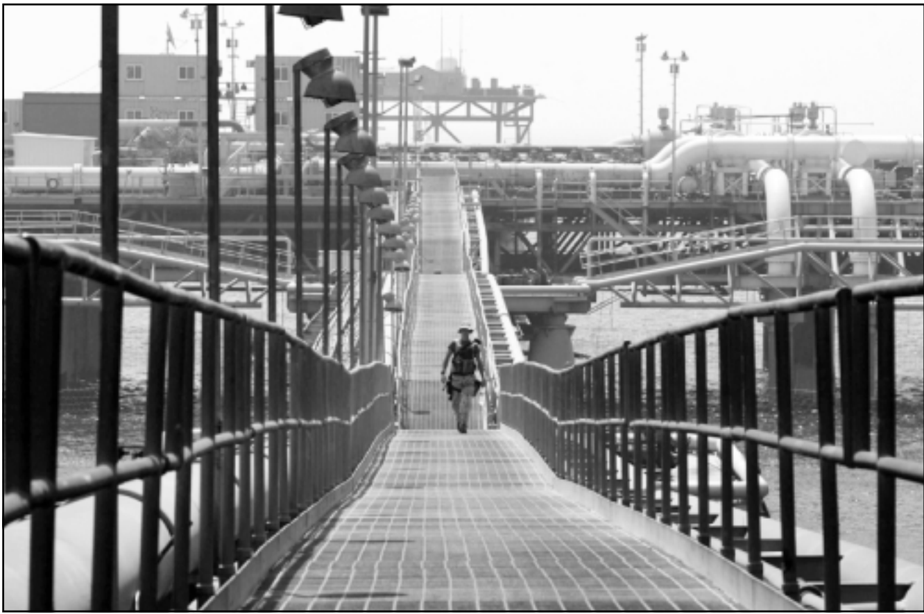
جندي عراقي يسير على جسر متصل بمنصة تصدير النفط في ميناء أم قصر القريب من البصرة

دقيقة» بالالتزامات التعاقدية وسجلات حسابات غير كاملة. وتابع التقرير ان بعض العقود الامريكية التي تشمل بأنها انتهت أو الغيت ما زالت تصف بأنها اربدة للعراق في حين زادت الدفوعات لبعض العقود عن القيمة الاجمالية للعقد.