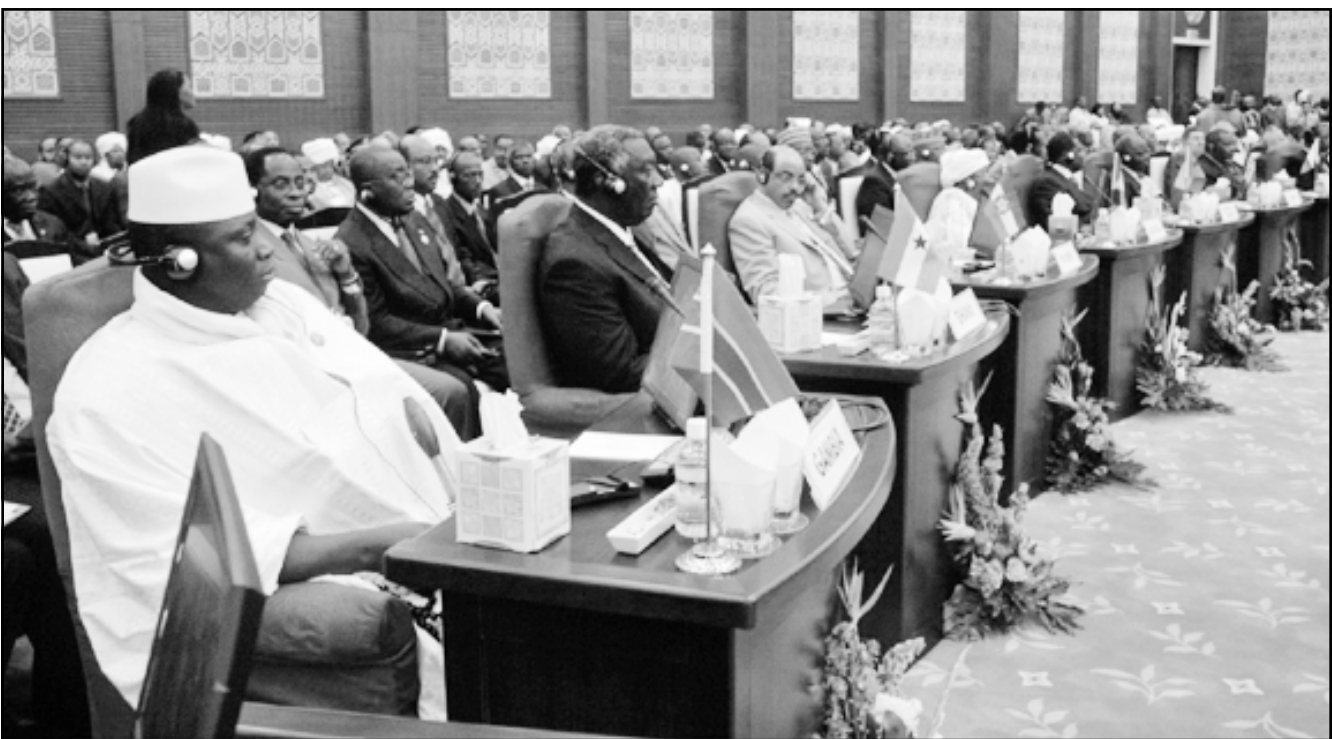
الرئيسان السوداني عمر البشير والنيجيري أوباسانجو أثناء مشاركتهما في قمة الاتحاد الأفريقي التي بدأت أعمالها في الخرطوم أمس