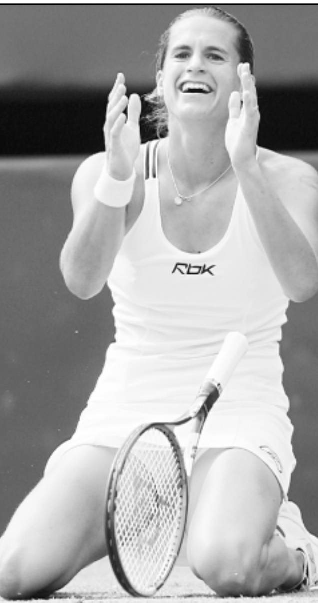
الفرنسية اميلي موريسمو لحظة فوزها ببطولة ويمبلدون

■ سانت لويس (الولايات المتحدة) - اف ب: جرد الملك الأمريكي كوري سينكس الروسي رومان كارمازين من لقبه بطلا للعالم في وزن فوق المتوسط (تصنيف الاتحاد الدولي) بفوزه عليه باللقب في المباراة التي اقيمت السبت في سانت لويس بولاية ميسوري الأمريكية. وحصل سينكس (28 عاما) في نهاية مباراة من 12 جولة ومن مستوى عال كانت المنافسة فيها شديدة. ونقاط اثنين من القضاة بنسبة 115 - 113. في حين اعلن الثالث تعادل الملاكمين 114 - 114 امام 12 الف متفرج. وخاض سينكس الذي ولد بعد 5 ايام من فوز والده ليون سينكس على محمد علي في شباط/فبراير 1978، اول مباراة في هذا الوزن فوق المتوسط ونجح بتحقيق الفوز مستفيدا من تفوقه الفني فرجع رشده الى 35 انتصارا مقابل 3 هزائم.