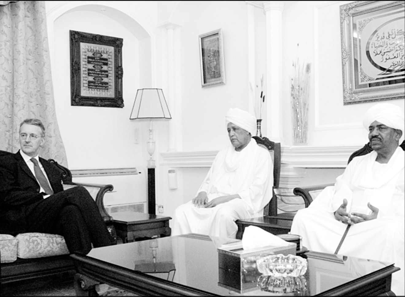
الرئيس السوداني عمر البشير اثناء استقباله هيلاري بن وزير التعاون الدولي والمبعوث الخاص لرئيس الوزراء البريطاني (روبيرت)