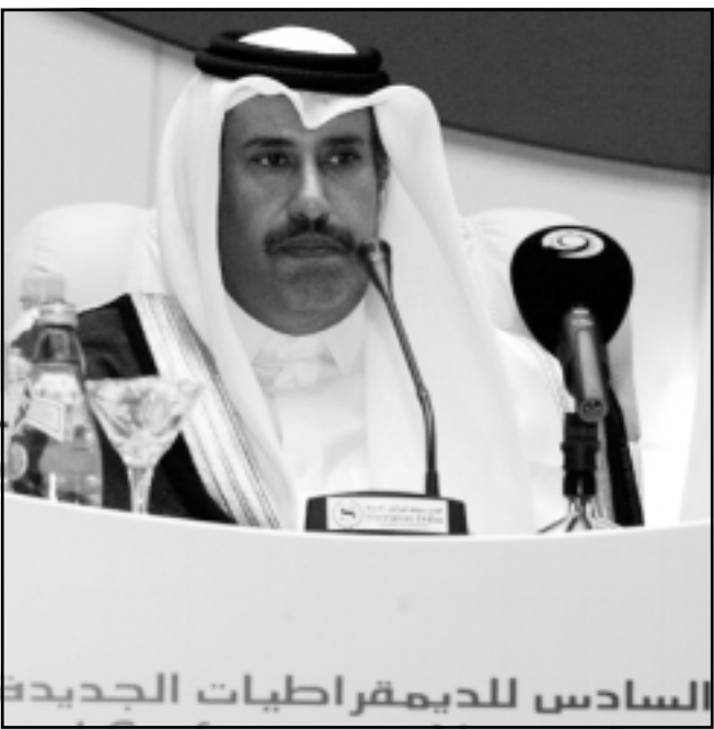
الشيخ حمد بن جاسم وزير الخارجية القطري اثناء جلسة افتتاح المؤتمر