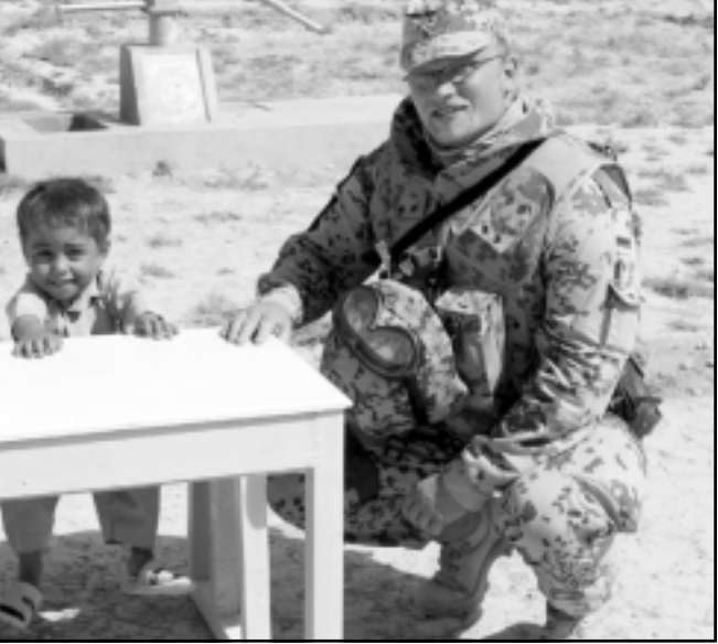
جندي الماني يجارو، عبر طفل افغاني في مزار الشريد، اصلاح السمعة السيئة التي الحقها زملاؤه بجيشهم بتدنيس جثث وجماع الموتى

القاعدة بشن هجمات ارهابية على كندا اذا لم تسحب قواتها من افغانستان، وفق ما نقلت صحيفة «ناشيونال بوست» الصادرة في تورونتو السبت، بينما أعلن عن مقتل جندي في القوة الدولية لاحلال الامن وعشرات الثوار في جنوب افغانستان. واطلقت القوة في بيان ان احد جنودها قتل وجرح ثمانية آخرون السبت في انفجار عبوة ناسفة عند مرور قافلة. ولم يوضح البيان جنسيات هؤلاء العسكريين. وأضاف البيان ان القوة تعرضت لهجوم شنه بين مئة و 150 متمردا في وادي شورا قرب احدي قواعدها السبت