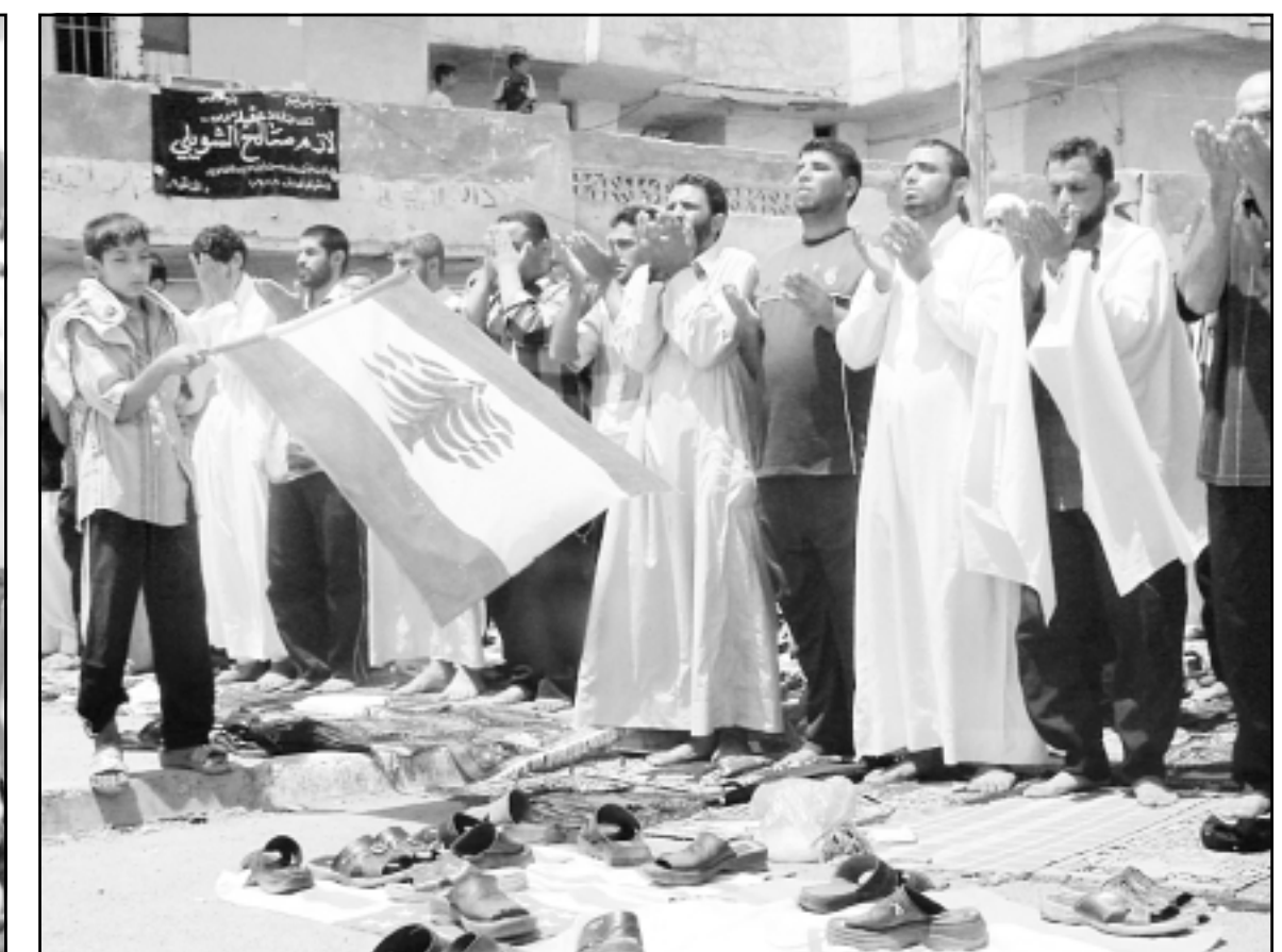
وفي بغداد صلوا للبنان ورفعوا علمه ووضعوا احذيتهم على علي اسرائيل وامريكا