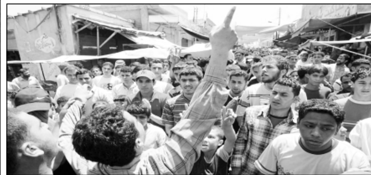
ومن زوراب مخيم البقعة عاهدوا اشقاءهم في لبنان بالبقاء الى جانبهم