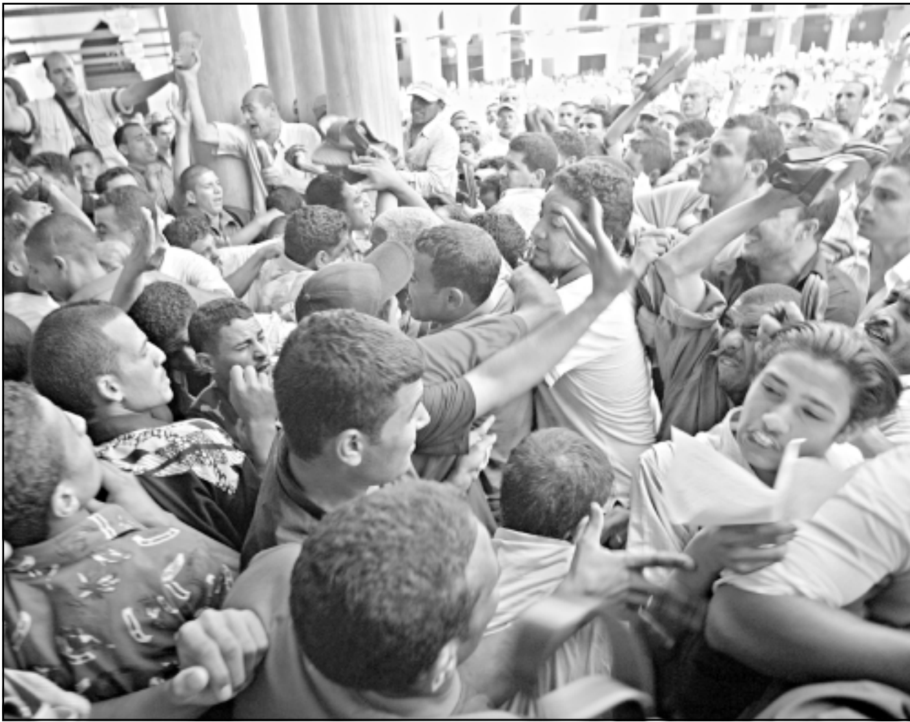
في القاهرة انهال المتظاهرون بالضرب على شرطة بلاياس مدني تحاول منعهم من الخروج من جامع الازهر