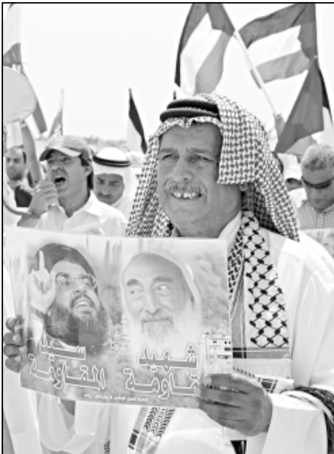
وفي البحرين حيوا شهيد المقاومة وسيد المقاومة في فلسطين ولبنان

الاشواق المسلمون في البلاد هتافات تأييد لحسن نصر الله ودعوا الى شن هجمات على المدن الرئيسية الاسرائيلية. وشارك نواب وزعماء بارزون من الحركة الاسلامية في المسيرة التي طافت باحد الشوارع الرئيسية بوسط العاصمة. وحث المراقب العام لجماعة الاخوان المسلمين سالم الوفا الاردنيين الى الشوارع الجمعة للاعراب عن تأييدهم للحركة حماس الفلسطينية وحزب الله اللبناني في مواجهة الهجمات الاسرائيلية. ورد المحتجون خلال مسيرة نظمها جماعة