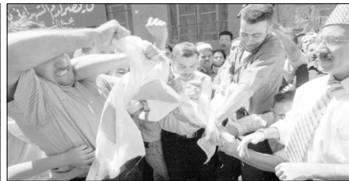
وفي سورية يمزقون بايديهم علم دولة الارهاب اسرائيل