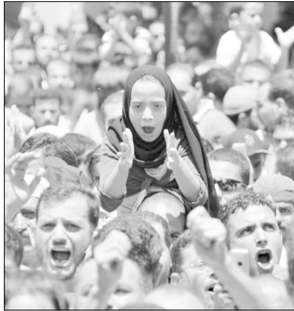
في العاصمة الأردنية عمان بعد صلاة الجمعة تجمعوا ونددوا