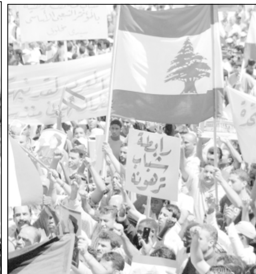
وجالت التنديدات في شوارع طرابلس الليبية رافضة الهجمة على لبنان وفلسطين