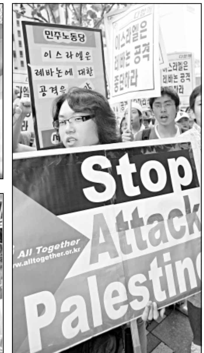
في سيول تجمعوا امام السفارة الاسرائيلية منددين بالحرب على فلسطين ولبنان