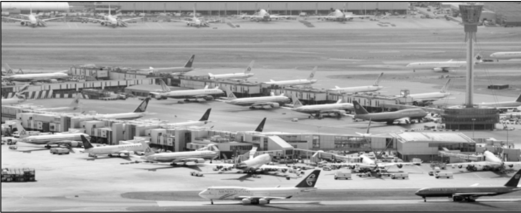
عشرات الطائرات جامئة بارضية مطار هيثرو الدولي بلندن، مما اربك حركة السير في الارض والجو البريطانيين

«جمعوا بالفعل كل ما يحتاجون اليه من عناصر وكانوا في المرحلة النهائية من الاعداد قبل الانتقال الى التنفيذ»، واضاف «لا اريد ان اكون اكثر تحديدا وذلك لدواعي التحقيق لكنها لم تكن مؤامرة في مرحلة التخطيط، موصحا «كانت هناك مراحل ملموسة جدا لتنفيذ كل مشاريع هذه الخطة»، وتابع «من الواضح ان المخطط له كان تنفيذ عدة تفجيرات في العديد من الطائرات لكنني اعتقد انه من الخطر جدا اعطاء رقم».