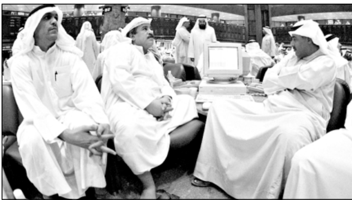
متعاملون في البورصة الكويتية

وارتفع سهم المصرية للاتصالات التي تخوض المنافسة أيضا ومن بين المرشحين للفوز بها 0,9 في المئة إلى 12,70 جنيه. وكان أكثر الاسهم ارتفاعا من حيث النسبة المئوية سهم بنك بيريوس مصر بعد ان رفع بنك بيريوس اليونان حصته في 5,5 في المئة إلى 94 في المئة. وصعد مؤشر هيرميس القياسي 613,5 نقطة أي بنسبة 1,4 في المئة إلى 43659 نقطة، فيما انخفض مؤشر التجاري الدولي الأوسع نطاقا مرتفعا 0,9 في المئة إلى 192 نقطة، وصعد مؤشر كيرس 30 بنسبة 1,6 في المئة إلى 4848,5 نقطة. الدولار يساوي 5,76 جنيه مصري.