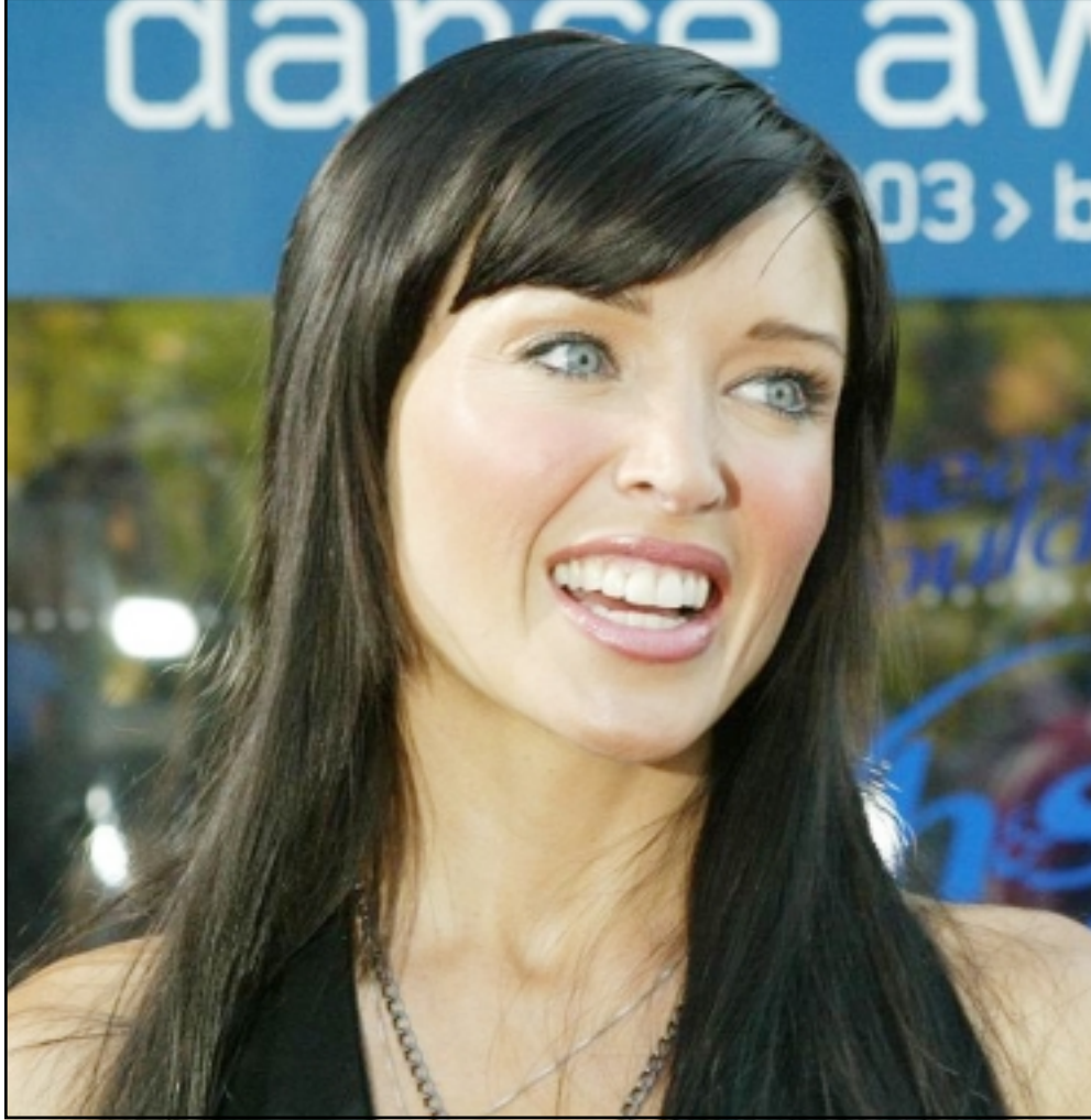
اعتلت المغنية الأسترالية كايلى مينوغ للمرة الأولى المسرح منذ أصابتها وشغافتها من مرض السرطان. وانضمت كايلى الى شقيقها المغنية داني على مسرح ناد ليلى في لندن ليل السبت الماضي، مما أثار عاصفة من التصفيق من قبل الحاضرين

وقالت اللجنة إن الدراسة التي أعدها أظهرت إن الأطفال الذين يواظبون على تناول المشروبات الخفيفة التي تحتوي على نسبة عالية من السكر يوميا تزداد أوزانهم بنسبة 60 %.