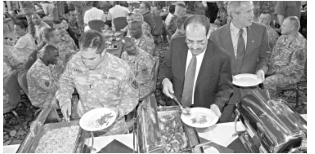
الملكى يتناول الغداء مع جنود امريكيين بصحبته بوش امس

الملكى ان «القدس العربي»: قال معلقون امريكيون ان زيارة الملكى لواشنطن كانت صعبة ولم تخل من الكثير من الحقائق المرة، وظهر هذا على وجه الرئيس الامريكي جورج بوش ونوري المالكي وذلك في المؤتمر الصحافي الذي عقد في «ايست روم»، وكان الملكى قد واجه غضب اعضاء الكونغرس الامريكي بسبب تصريحاته