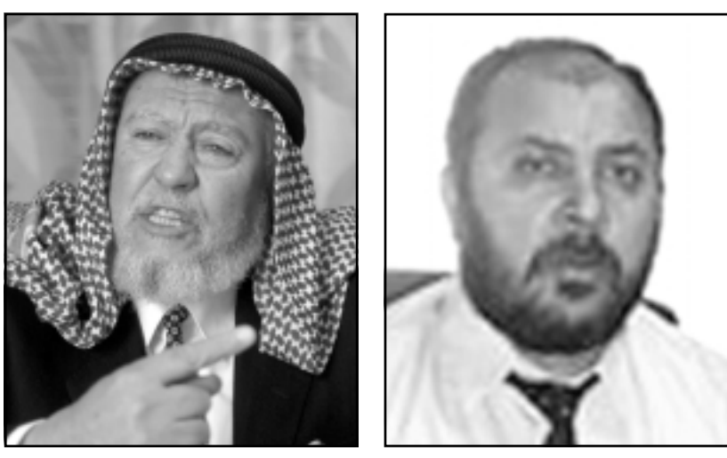
الشيخ حمزة منصور

كانت الاخبار والنووعات الرئيسية في الصحف المصرية الصادرة افس عن قيام النيابة بالتحقيق مع أكثر من مائتي ائمة في بلد طوط وتغير اسرار أخرى متضاربة، والنظر في طلب رفع الحصانة عن صاحب الشركة وعضو مجلس الشغب عن الحزب الوفاي بين سرور، وذلك لان سبتيع السيد الوفاي يدمرون الوحدة الوطنية حقيقة، وان انتهاء النيابة من تحقيقاتها وكيفية التصرف فيها، ولجنة الصياغة التنفيذية