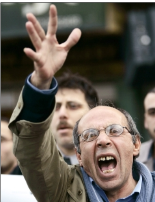
فلسطيني يشارك في مظاهرة في مدينة رام الله تطالب بوقف الاقتتال الداخلي