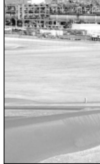
مشهد بانورامي لنشأة ابقيق السعودية العملاقة لتجميع وتكرير النفط

وقال عالم متخصص في الاجناس البشرية يتخذ من لندن مقرا له ان «هذا الازدهار هو المشكل - انه يقوم على اساس بيع سلعة امان طلب كبير وليس بناء على اعساده هيكلية الاقتصاد السعودي لخلق فرص عمل بين الشبان العاطلين».