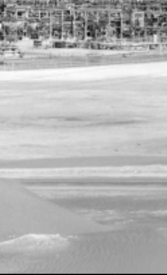
مشهد بانورامي لنشأة ابقيق السعودية العملاقة لتجميع وتكرير النفط

وقال عالم متخصص في الاجناس البشرية يتخذ من لندن مقرا له ان «هذا الازدهار هو المشكل - انه يقوم على اساس بيع سلعة امان طلب كبير وليس بناء على اعساده هيكلية الاقتصاد السعودي لخلق فرص عمل بين الشبان العاطلين».