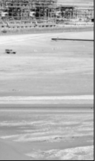
مشهد بانورامي لنشأة ابقيق السعودية العملاقة لتجميع وتكرير النفط

ومنذ بدء الازدهار النفطي كان التطور الرئيسي في السياسة الخارجية السعودية تحولاً غير ضار نسبياً للمصالح في اتجاه شرق اسيا والشرق الاوسط.