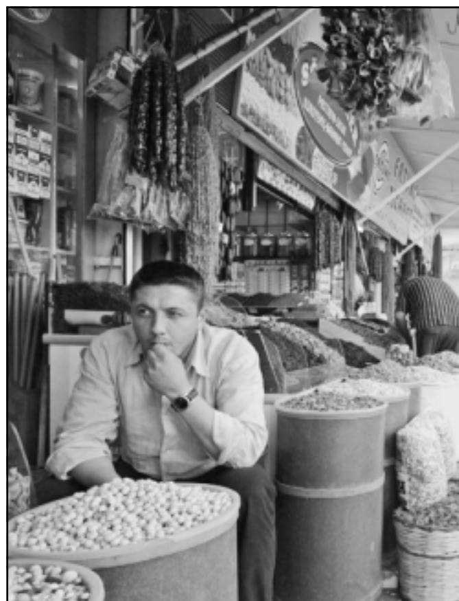
سوق تقليدي في مدينة قيساري بوسط تركيا

وقال معهد الاحصاء التركي ان الناتج المحلي الاجمالي الذي يستبعد بعض الإيرادات المحققة في الخارج نما بنسبة 6.4 في المئة في الاشهر الثلاثة الاولى من العام مقارنة مع توقعات الاقتصاديين بان يبلغ 5.3 في المئة في الربع الثاني من العام.