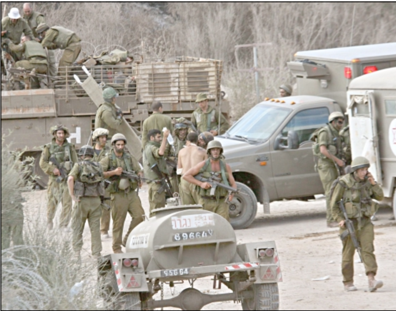
..جنود اسراييليون ينقلون زملاء لهم اصيبوا اثناء مواجهات مع حزب الله