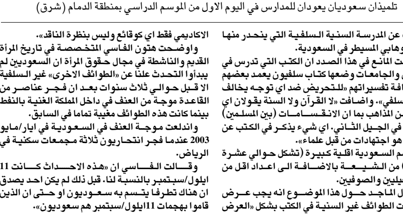
تلميذان سعوديان يعودان للمدارس في اليوم الاول من الموسم الدراسي بمنطقة الدمام (شرق)

■ مقديشو- اف ب: طلب الاسلاميون الصوماليون الخميس من الامم المتحدة والمنظمات الدولية تقديم المساعدة للصومال ولكتهم كمرور ورفضهم لوجود قوة حفظ سلام. واوضح الشيخ ضاهر عويس، زعيم الحاكم الشرعية، خلال لقاء مع مسؤولين من الامم المتحدة ان موظفي الامم المتحدة والعمال الانسانيين الاخرين مرحب بهم في البلاد وستقدم لهم ضمانات امنية. وقال ان المجلس الاعلى الاسلامي في الصومال لن يسمح ايدا بوجود قوات اجنبية. واضاف «دعونا الامم المتحدة والمنظمات الدولية للمجعي الى الصومال واكدنا ان اي شيء لن يحصل لهم، و اشار الى انه «جاءوا بانهم سيداؤون بالعمل عندما يحصلون على ضمانات تتعلق بانهم مضميفا «نحن بحاجة كي يفعلوا اكثر تسعة الناس هنا».