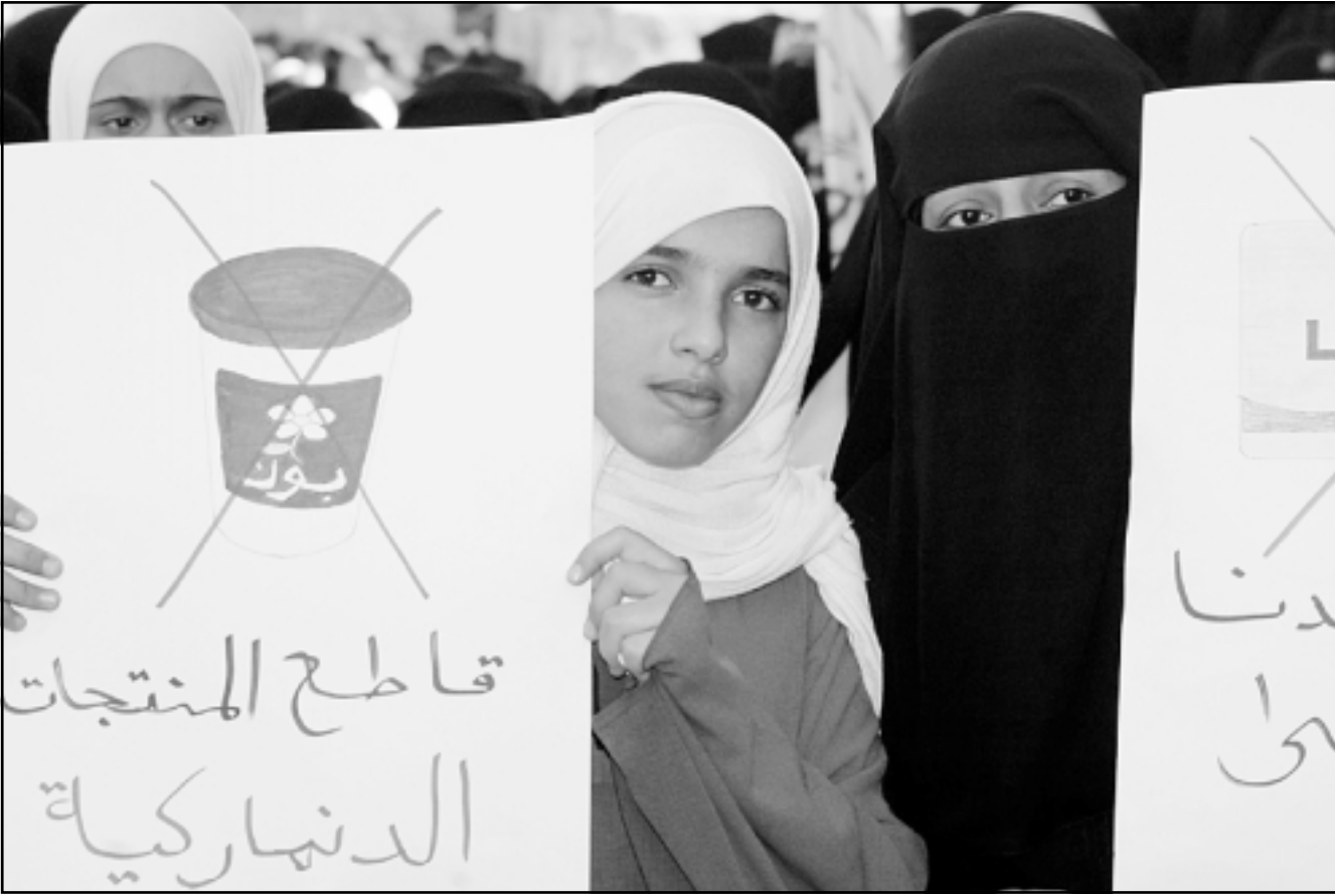
طالبات يمنيةات يشاركن في مظاهرة تدعو لمقاطعة البضائع الدنماركية (رويترز)

وتحركات المسيرة اليمنية النسائية التي حملت شعارات ولافات منددة ومستنكرة للتطاول على الأنبياء والأديان، من ميدان السبعين بوسط