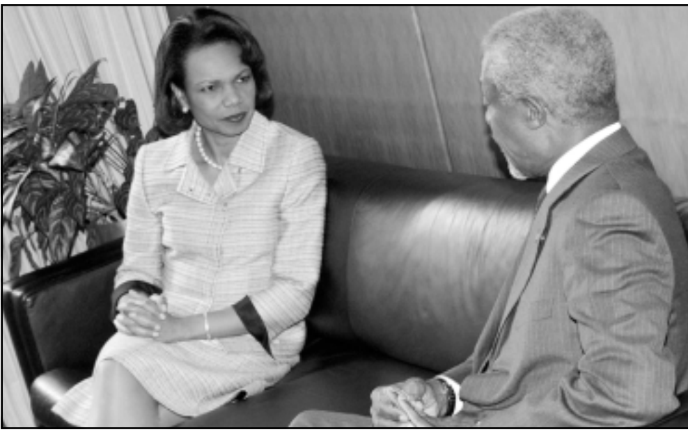
الامين العام للأمم المتحدة لدى لقائه وزيرة الخارجية الأمريكية

ولتعزيز الانسحاب من معاهدة منع الانتشار النووي خلافا لما الحج الرئيس الإيراني الأحد. وقال «ليس لدينا اي سبب للانسحاب من معاهدة منع الانتشار النووي». وأضاف «ما نحتاج اليه هو توازن بين الواجبات والحقوق التي تنص عليها معاهدة منع الانتشار النووي». وجاء المسؤل الإيراني المكلف الملف النووي الإيراني على لجانته الثلاثاء في أفيها «بمكتان القول أن بعض الدول تتصرف بشكل واقعي» في قضية الملف النووي الإيراني ناكسرا «الصين وروسيا». وتبدي ويكن وموسكو اللتان تربطهما مصالح اقتصادية بطهران لا سيما في مجال الطاقة. تحفظات كبيرة حول الإشارة الواردة في مشروع القرار الجاري درسه ال الفصل السابع من شرعة الأمم المتحدة الذي يدفع المجال امام فرض عقوبات وحتى تدخل عسكري في آخر المطاف.