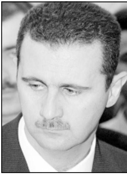
الرئيس بشار الأسد