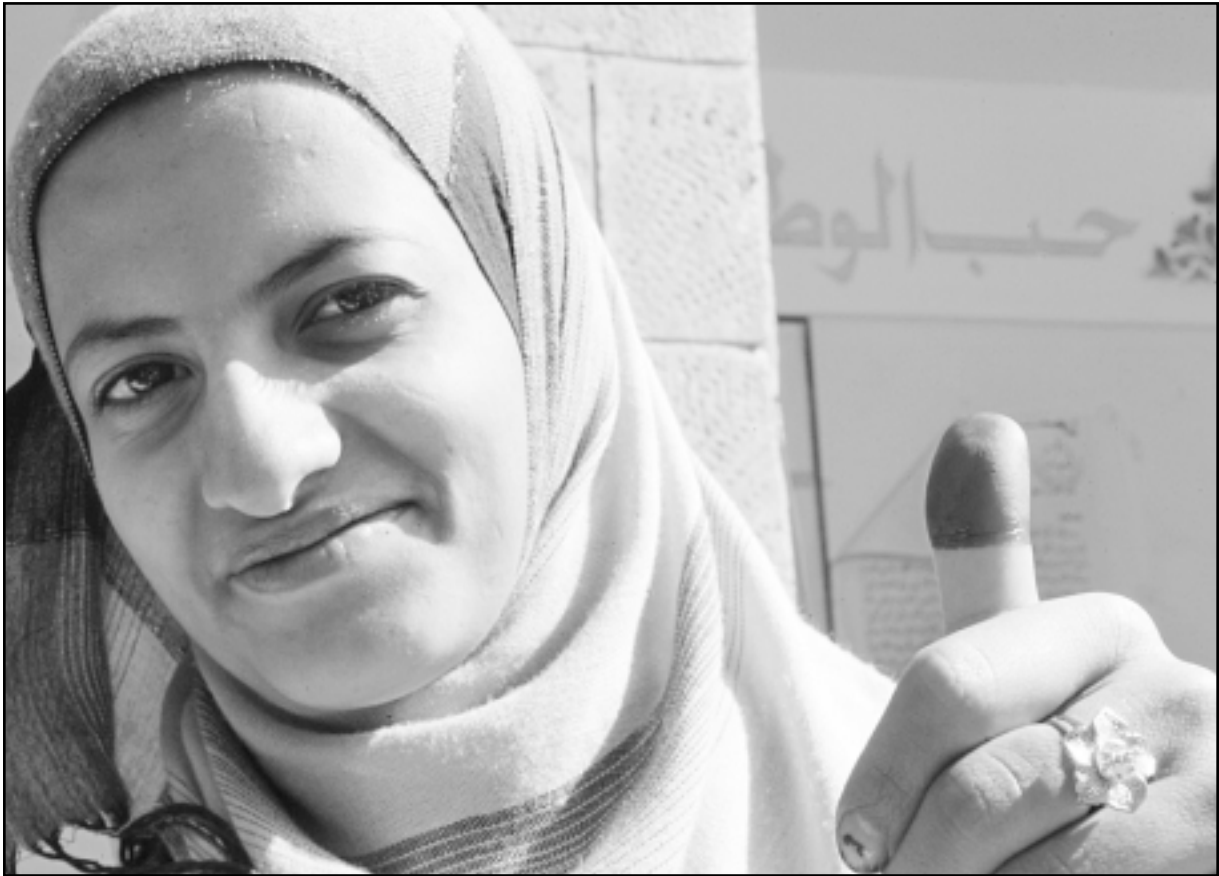
سيدة يمنية بعد اطلاقها بصوتها خلال الانتخابات الرئاسية في اليمن

ان الحرس الجمهوري اعتقل مرشحين يتبعون لاجزاب المعارضة ويضض رجال الامن يهددون الناخبين، والدعاية الانتخابية لحزب المؤتمر الحاكم تتواصل داخل لجان انتخابية في محافظة ريمه اثناء عملية الاقتراع على الرغم من حظرها قانونيا، واقتراع علني في بعض دوائر محافظتي تعز وصعدة، ونتائج الاقتراع في بعض مراكز محافظة الجوف، واحزاب اللقاء المشترك المعارضة حذرت من انفجار الوضع في منطقة صوران بمحافظة ذمار.