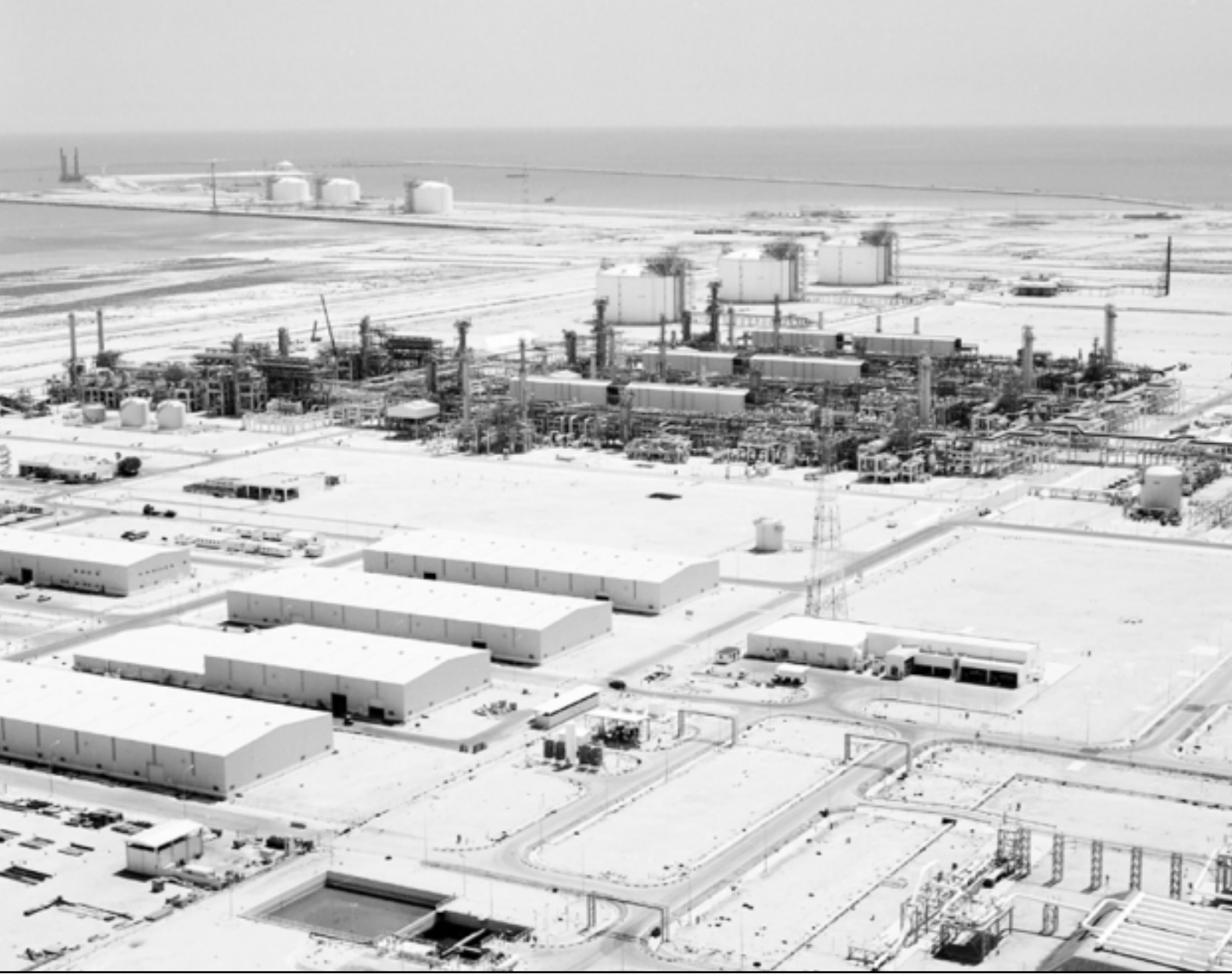
صورة بانورامية لمشروع تسهيل الغاز في رأس لفان في قطر

وقال مهندس التفت به رويترز أثناء الزيارة انه كان من المفترض أن يتقاعد