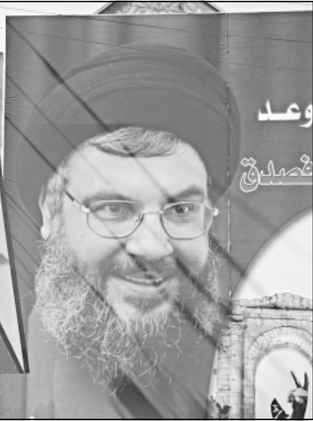
صورة لصرالله في بيروت ويجانبها لافتة تدعو لمقاطعة أمريكا