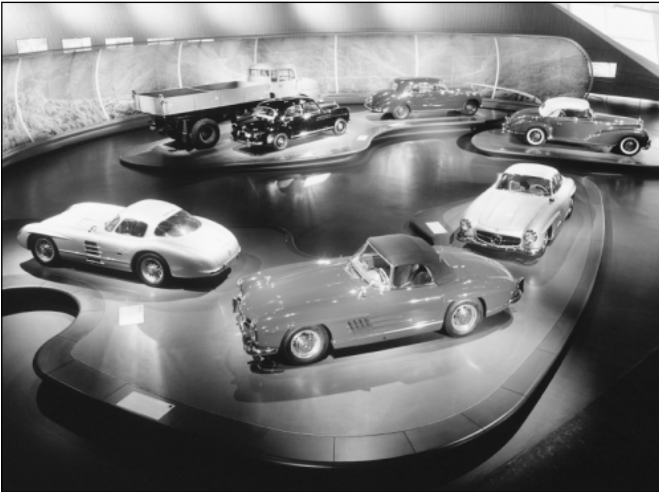
عدد من سيارات مرسيدس لدى عرضها اسم الجمعة في متحف للشركة الألمانية المملعة ضم 1500 طرازا من انتاجها

ونظرا لاحتفاظ أحزاب الائتلاف في حكومة ميركل بأغلبية كبيرة في البوندستاغ المكون من 614 مقعدا فقد كان من المتوقع على نطاق واسع أن تفوز بالاقتراع.